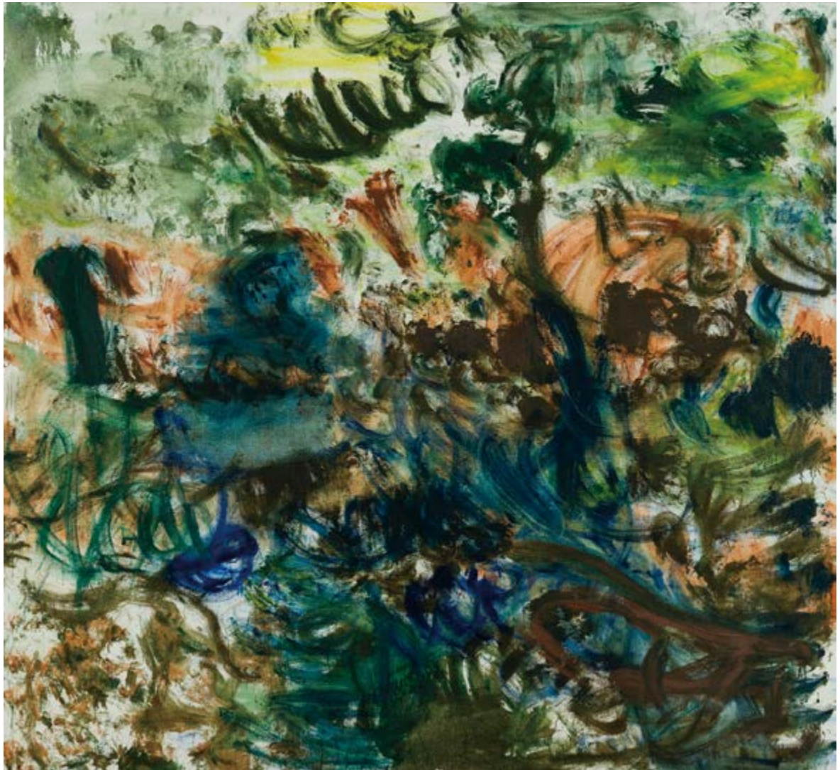
《花园》，2017，布面油画，250 x 300 厘米，98 38 x 118 18 英寸，张恩利。