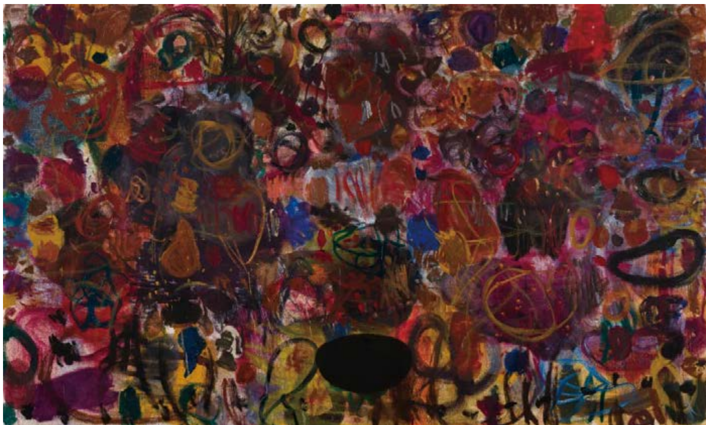
《穿正装的男人》，Middle-aged Man Formal Wear, 2021，布面油画，210x350cm

丹麦画家佩尔·柯克比（Per Kirkeby）是地质学背景出身，他的绘画同样拥有这种根茎系统，泞泥土地中的地质层纹理伴随着牲口般的嚎叫声将持续内推画面轮转造成魔力，这种毁灭和洗礼有着北欧式的宗教感和原始的野蛮，“开阔的土地的树皮、大理石花纹、火山口、悬崖炭疽、舱口条纹、矿物石燃烧的黄色硫磺和淡淡的微光”，艺术家如是说。他的画面在遭受一次又一次颠覆后能立住，这是艺术一致性模仿世界一致性的问题，但这种抽象化图景仍然是一场有节制的私人化考古，是对人类意识模拟或建模，如果说把佩尔·柯克比（Per