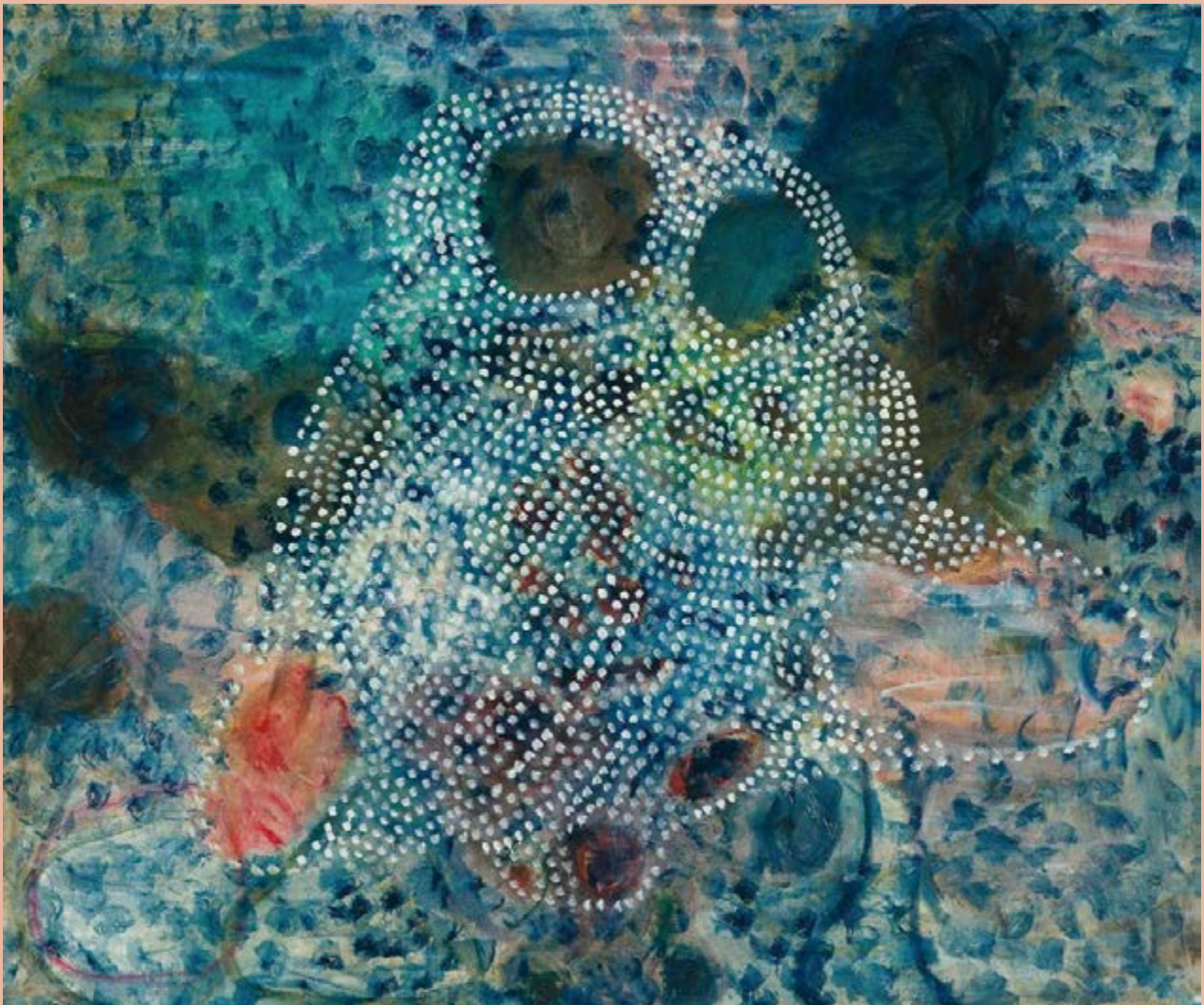
《武士》，A Warrior，2020，布面油画，250x300cm，张恩利

A review on Zhang Enli's exhibition A House With Color