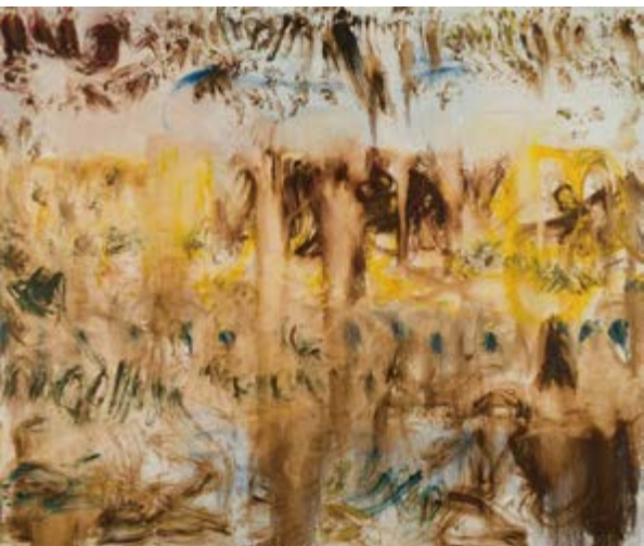
《花园》，2017，油彩画布，250 x 300 厘米 98.38 x 118.18 英寸，张恩利

吃口却依旧重油重辣，味蕾会瞬间被刺激和放大，却缺乏后续层次玩味，而张恩利的丰富和厚实恰恰在薄，这种儒雅风流就像钢琴演奏中颗粒感清晰的逻辑重音，含蓄而饱满，知白守黑。张恩利从来不会滥用颜料，早年的他也是有的放矢局部渐强，我相信蒙克在他心目中是极有分量的。在近期的采访中他如是说：“在面对这张画布的时候，我希望能够袒露更多的东西，不需要太多的优雅来掩饰什么。这个薄是因为不能完全覆盖，把所有的涂改过的过程和画错的全部暴露出来，形成一个共同的关系。我觉得用薄的方式，涂改也会把底层露出来，因为不够厚，一张画里面没有对错，我勾错了它还在，你也能看到。”这也印证了黄宾虹地开卷有益：“应如作字法，笔笔亦分离。”