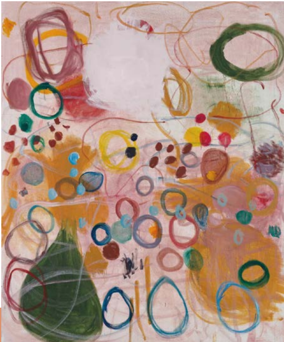
珠宝商人 | 布上油画, A Jeweler Oil on canvas, 300cm × 250cm, 2021, 张恩利