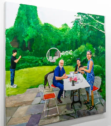
朱加和韩梦云的个展，巴塞爾艺术展现场， 图片致谢：香格纳画廊