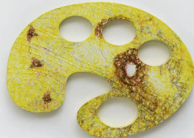
关小，《谁点燃了太阳？是黑暗？》，2022，图片致谢：天线空间