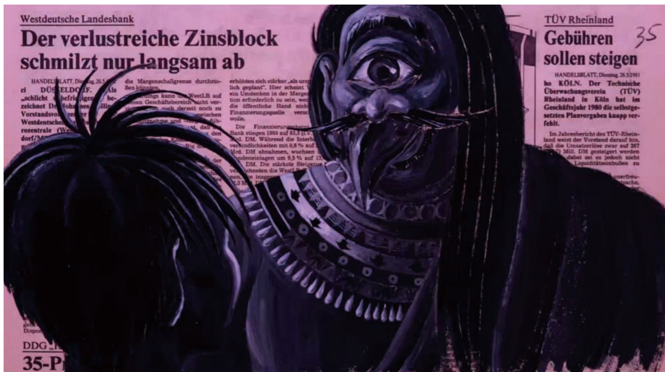
《魔法星图》(艺术家剪辑版) 2025年, 视频动画, 30分钟