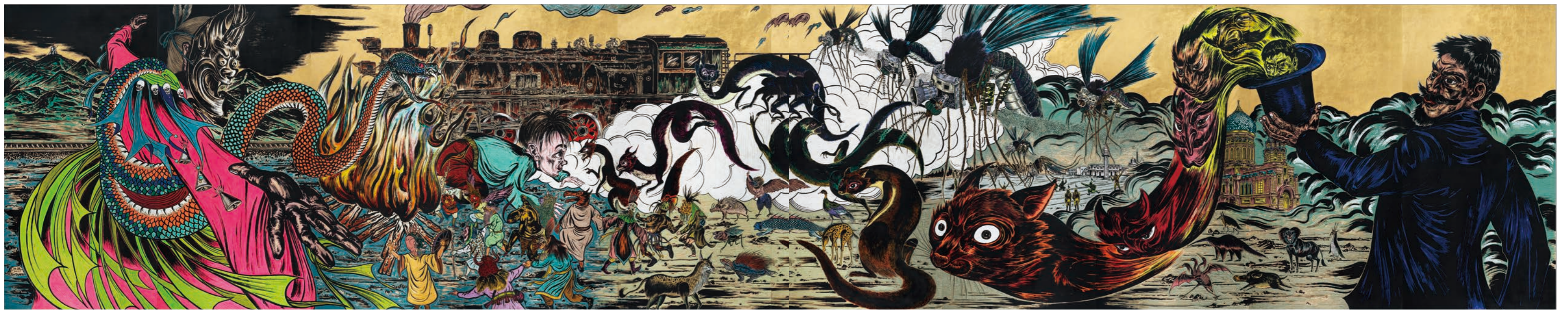
〔下图〕 《螺刹——魔术师的幻术》 2023年，木刻画，183厘米×920厘米 图片鸣谢艺术家及香格纳画廊