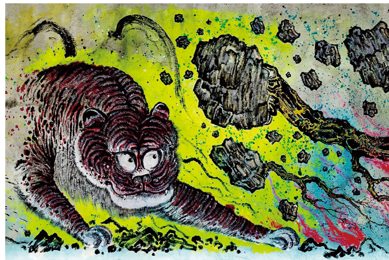
《神话与反骨》(局部) 2020年，手工纸上荧光墨水、金粉、矿物质颜料，240厘米×3100厘米

此刻回看，那是一个充满希望的年代。当我走进古根海姆美术馆、PS1现代艺术中心、大都会博物馆与史密森学会时，惊喜地发现越来越多中国艺术家、从业者身现其中：侯瀚如、翁笑雨、汪建伟、杨福东、曹斐、徐冰、徐震……孙逊也在其列。自2009年起，“人文交流”被正式纳入中美高层对话议程，一系列留学与民间交流项目陆续启动。与奥巴马政府“重返亚洲”的战略相呼应，2008年至2016年间，美国文化界热切地拥抱中国当代艺术。古根海姆美术馆、纽约现代艺术博物馆、大都会博物馆等机构接连举办关于中国艺术的重磅展览。孙逊正是在这波浪潮中进入了美国主流艺术视野，被我和同学在古根海姆美术馆的展览目录中发现；而我本人也受到同一时代浪潮的感召，成为投身艺术的年轻留学生。