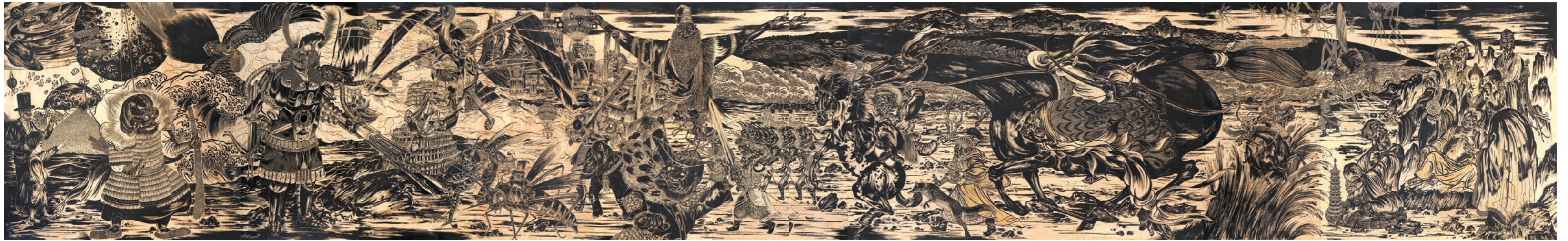
〔上图〕 《螺刹——千江有水千江月》 2020—2022年，木刻画，244厘米×1586厘米