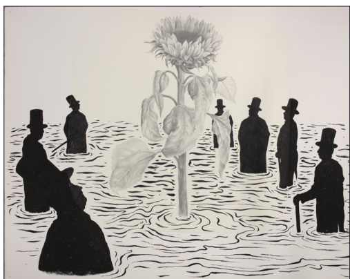
诗歌工厂No.3, 2010, 孙逊