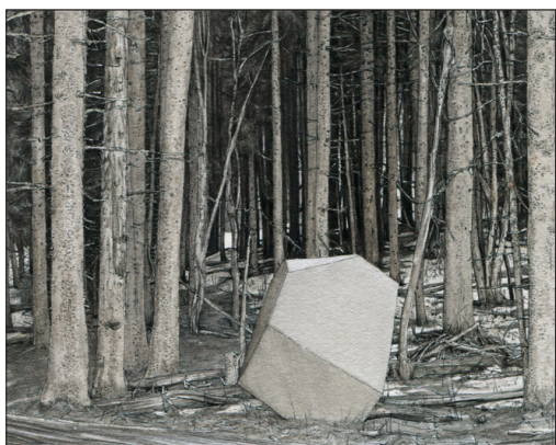
忧郁No.2, 2011, Fabien Mérelle (细节)