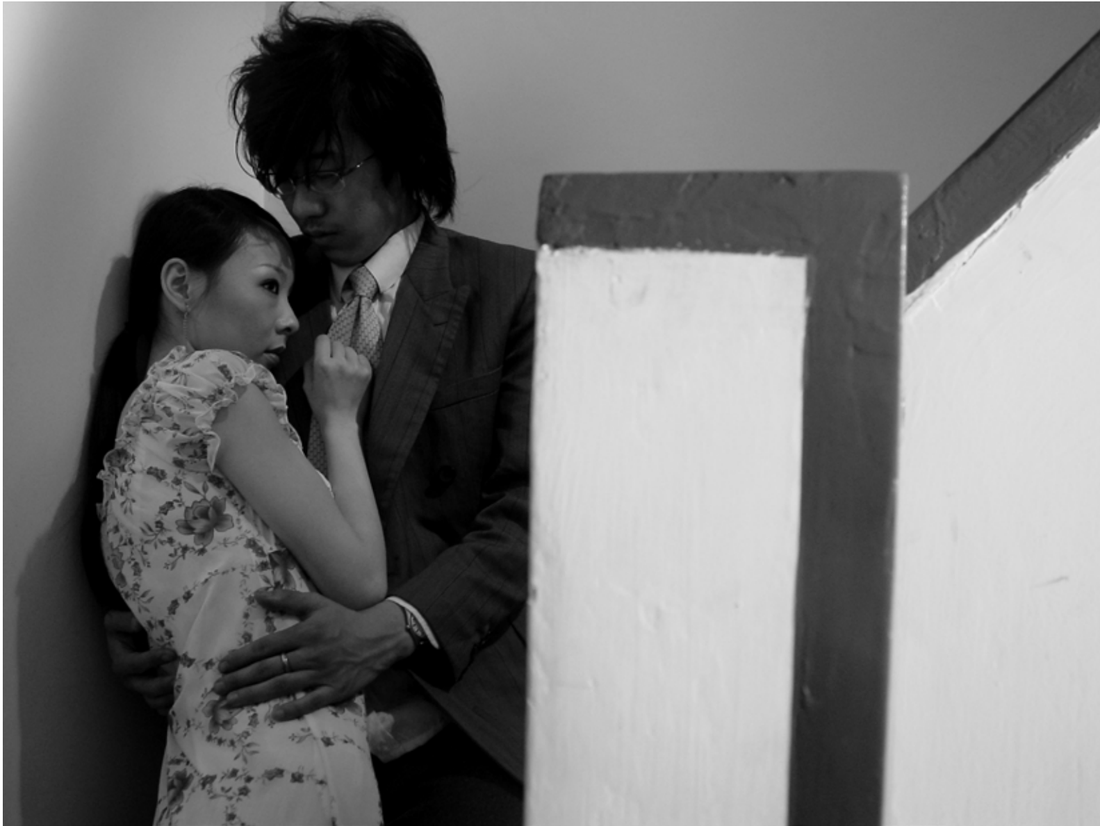
竹林七贤 之二 / Seven Intellectuals in Bamboo Forest, Part 2 (2004) 摄影 / Photo C-Print / 114 X 86 cm / Ed.10 / YFD_1020