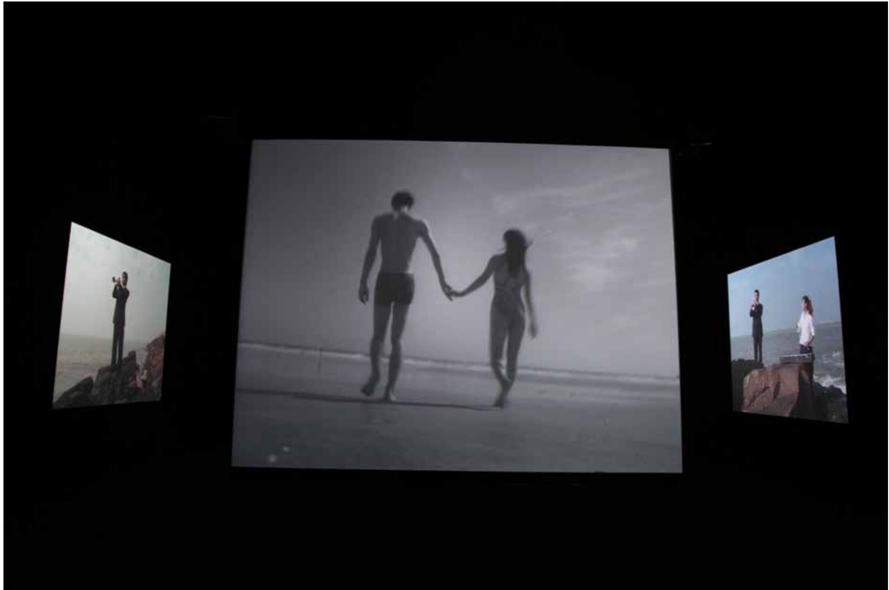
靠近海 / Close to the Sea 10 屏影像装置 10 channel video installation 23' (2004) YFDV16