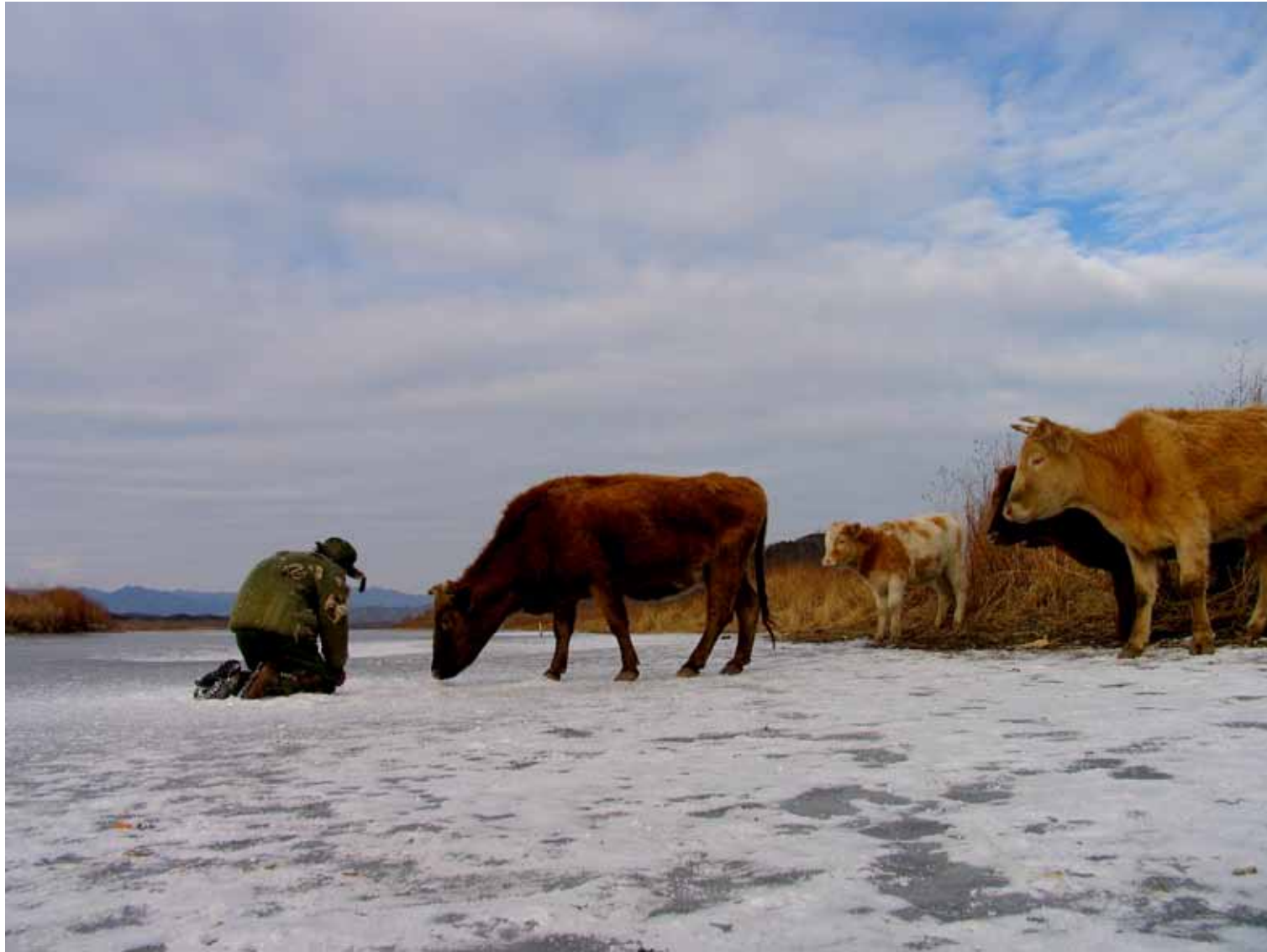
等待蛇的苏醒 / The Revival of the Snake (2005) 剧照 / Image