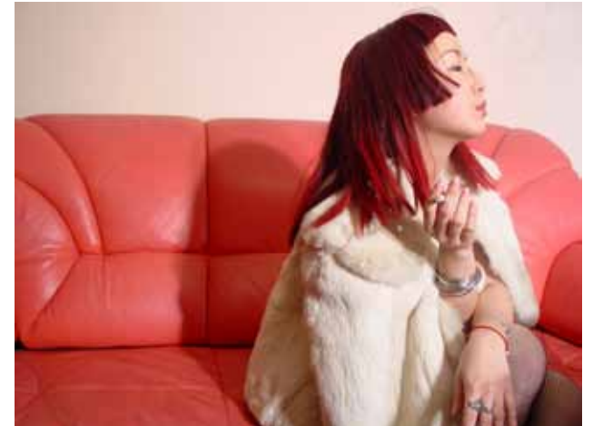
蜜 / Honey (2003) 摄影 / Photo 50 X 70 cm X 3 Pieces / Ed.10 YFD14-3, YFD14-9, YFD14-1