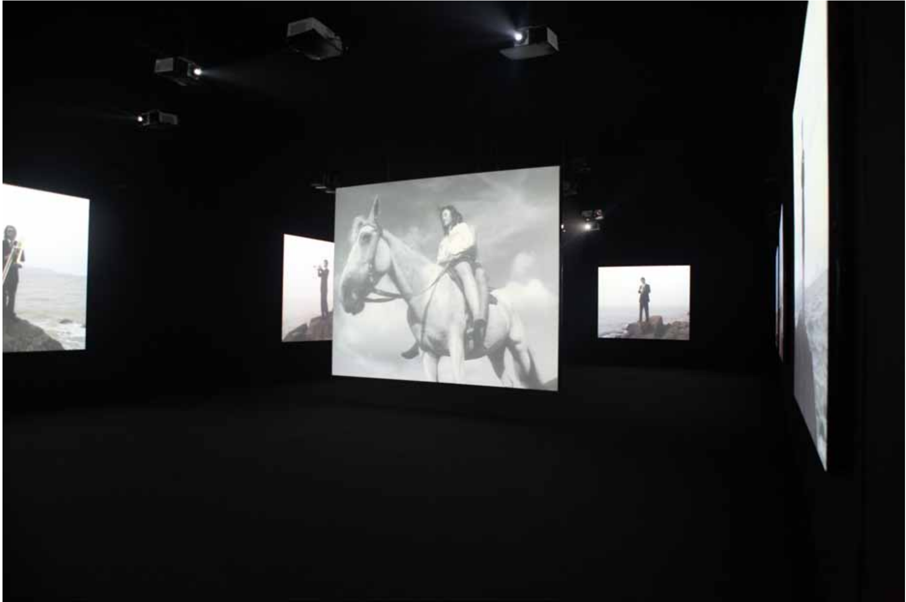
靠近海 / Close to the Sea 10 屏影像装置 10 channel video installation 23' (2004) YFDV16