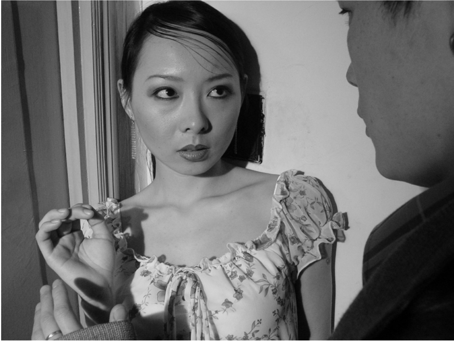
竹林七贤 之二 / Seven Intellectuals in Bamboo Forest, Part 5 (2004) 摄影 / Photo C-Print / 112 X 83 cm / Ed.10 / YFDU087