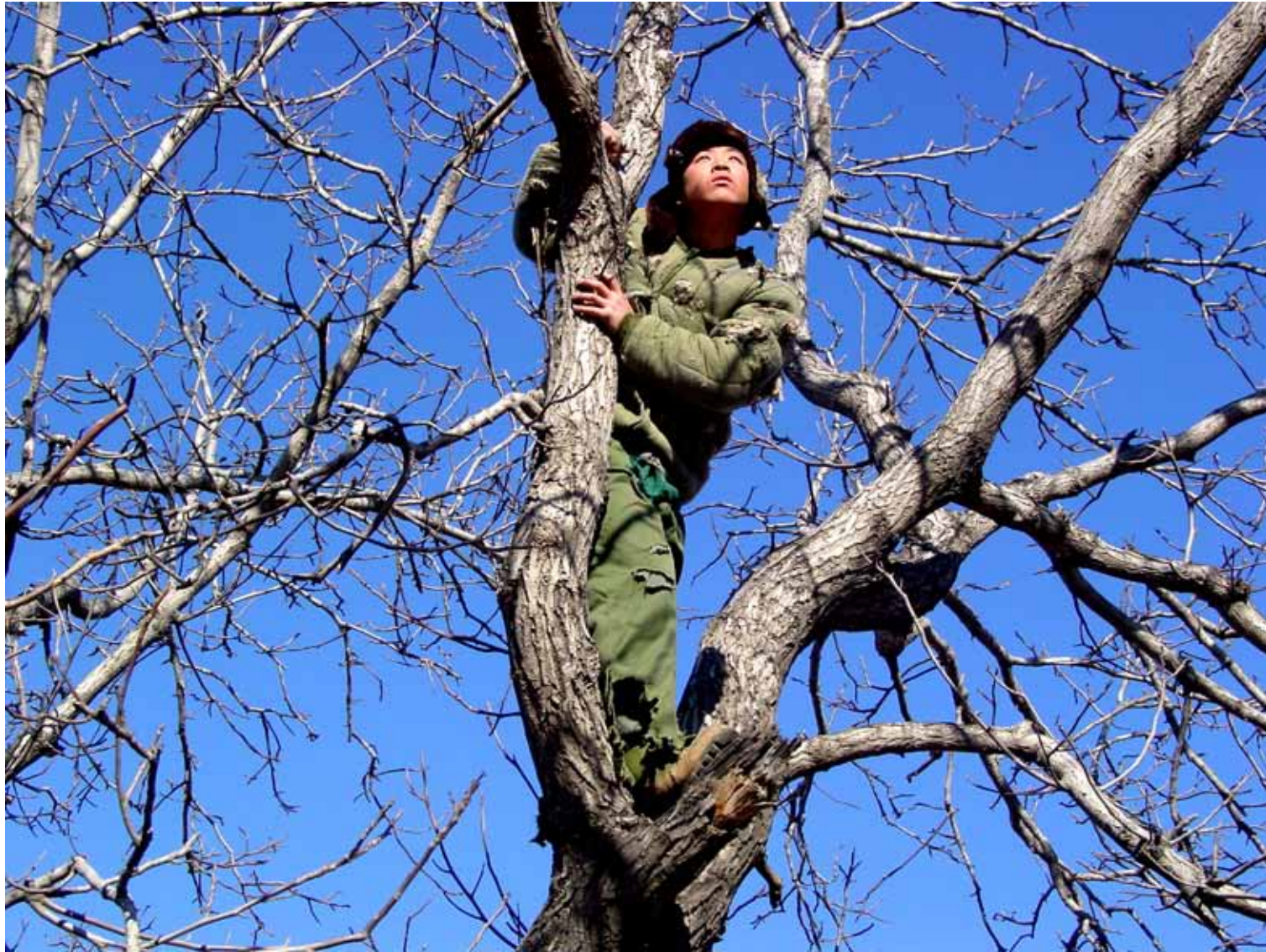
等待蛇的苏醒 / The Revival of the Snake (2005) 剧照 / Image