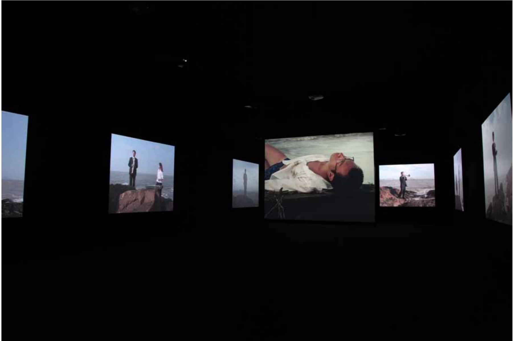
靠近海 / Close to the Sea 10 屏影像装置 10 channel video installation 23' (2004) YFDV16