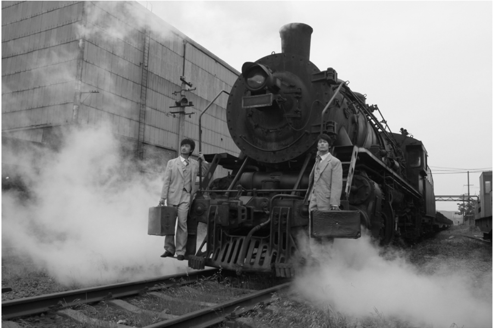
竹林七贤 之五 / Seven Intellectuals in Bamboo Forest, Part 5 (2007) 摄影 / Photo C-Print / 120 X 180 cm / Ed.10 / YFDU099