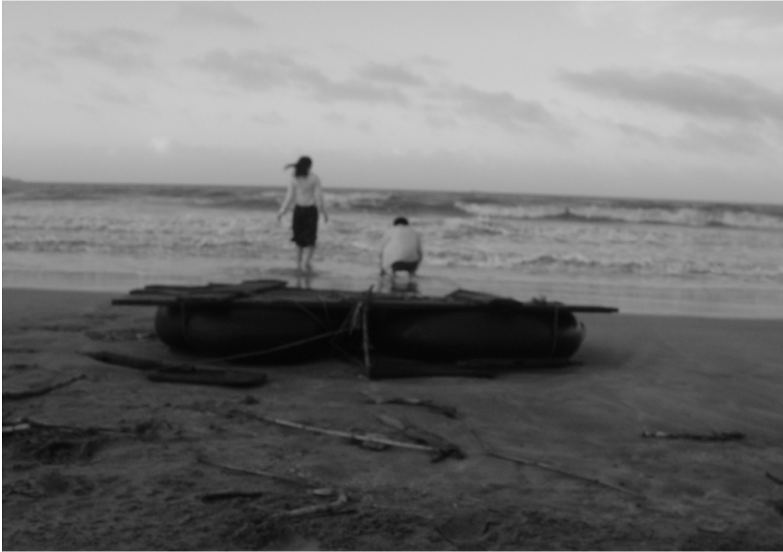
靠近海 / Close to the Sea (2004) 截屏 / Still