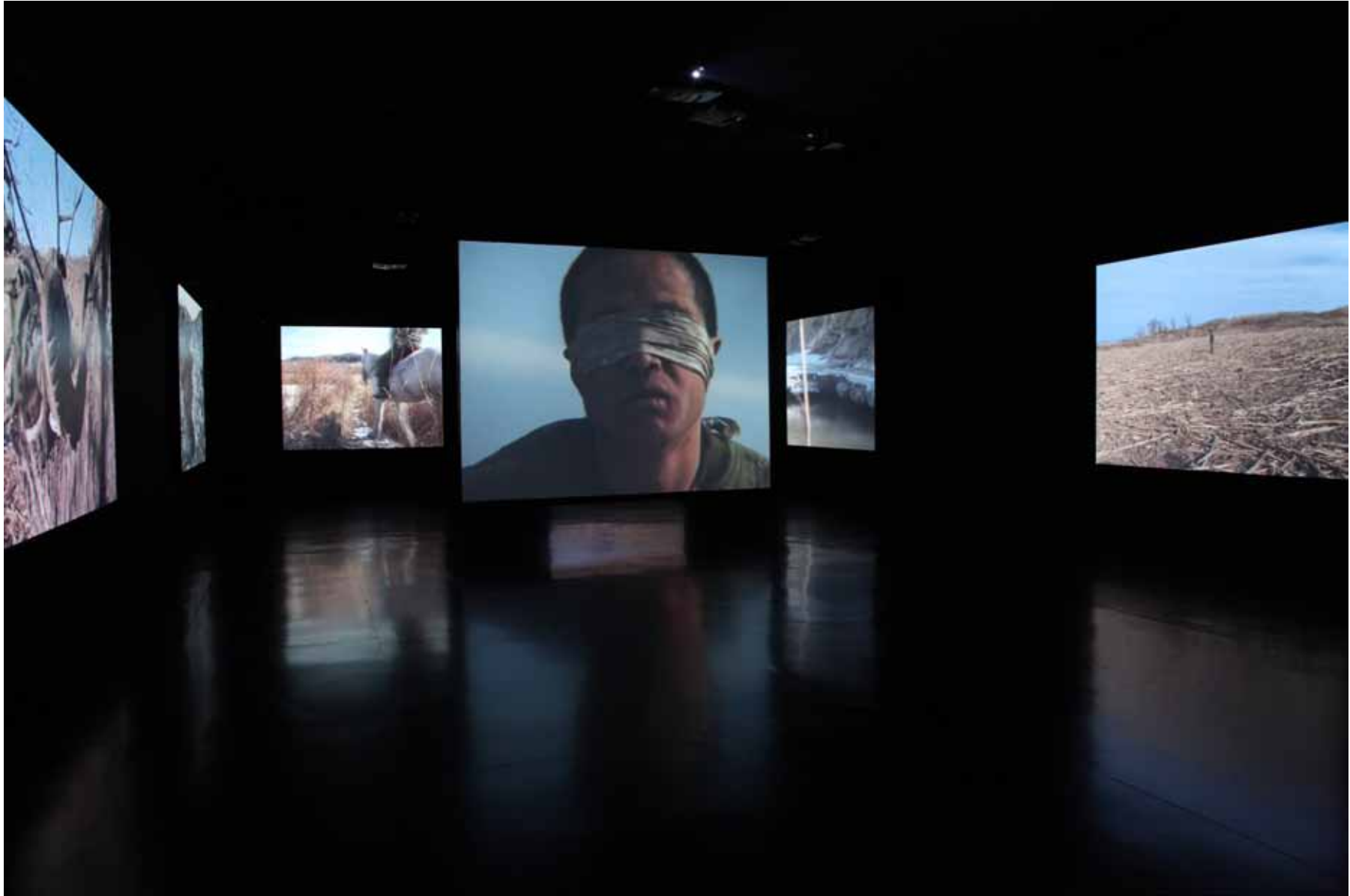
等待蛇的苏醒 / The Revival of the Snake 10 屏影像装置 10 channel video installation 8' (2005) YFDV22