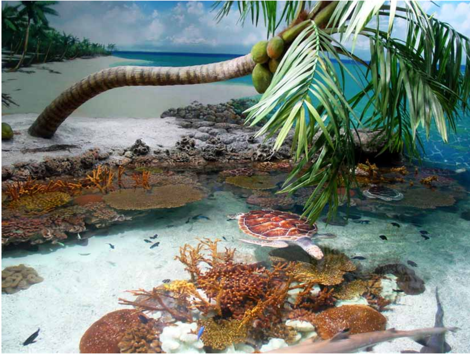
小兵 YY 的夏天 / Minor Soldier YY's Summer (2003) 摄影 / Photo / 100 X 75 cm / Ed.10 / YFDU075