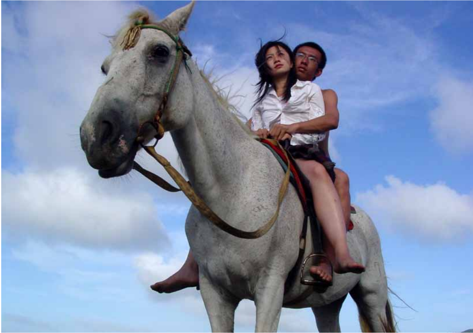
靠近海 / Close to the Sea (2004) 截屏 / Still