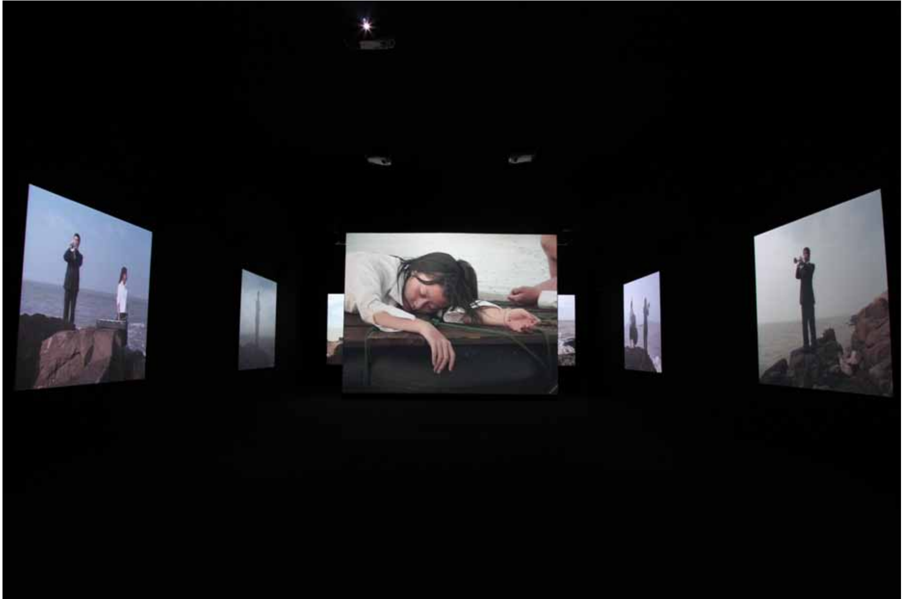
靠近海 / Close to the Sea 10 屏影像装置 10 channel video installation 23' (2004) YFDV16