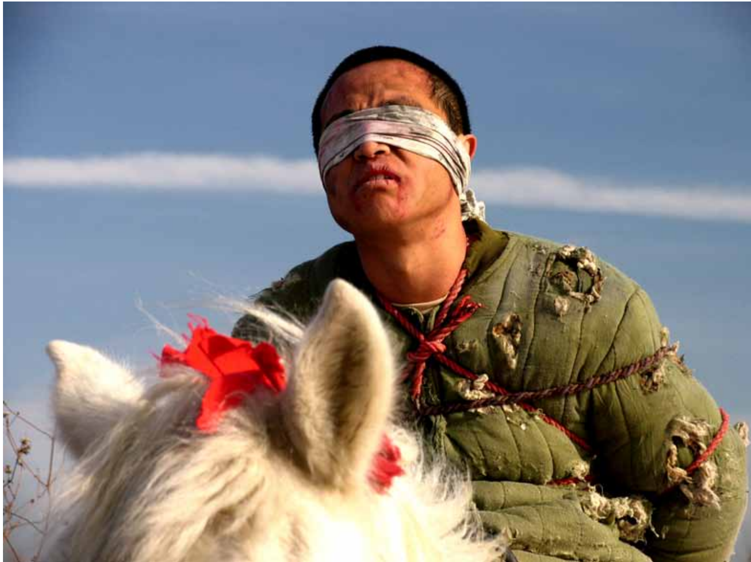
等待蛇的苏醒 / The Revival of the Snake (2005) 剧照 / Image