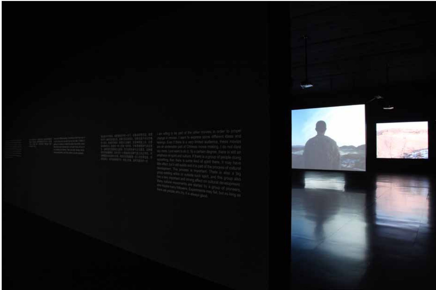
等待蛇的苏醒 / The Revival of the Snake 10 屏影像装置 10 channel video installation 8' (2005) YFDV22