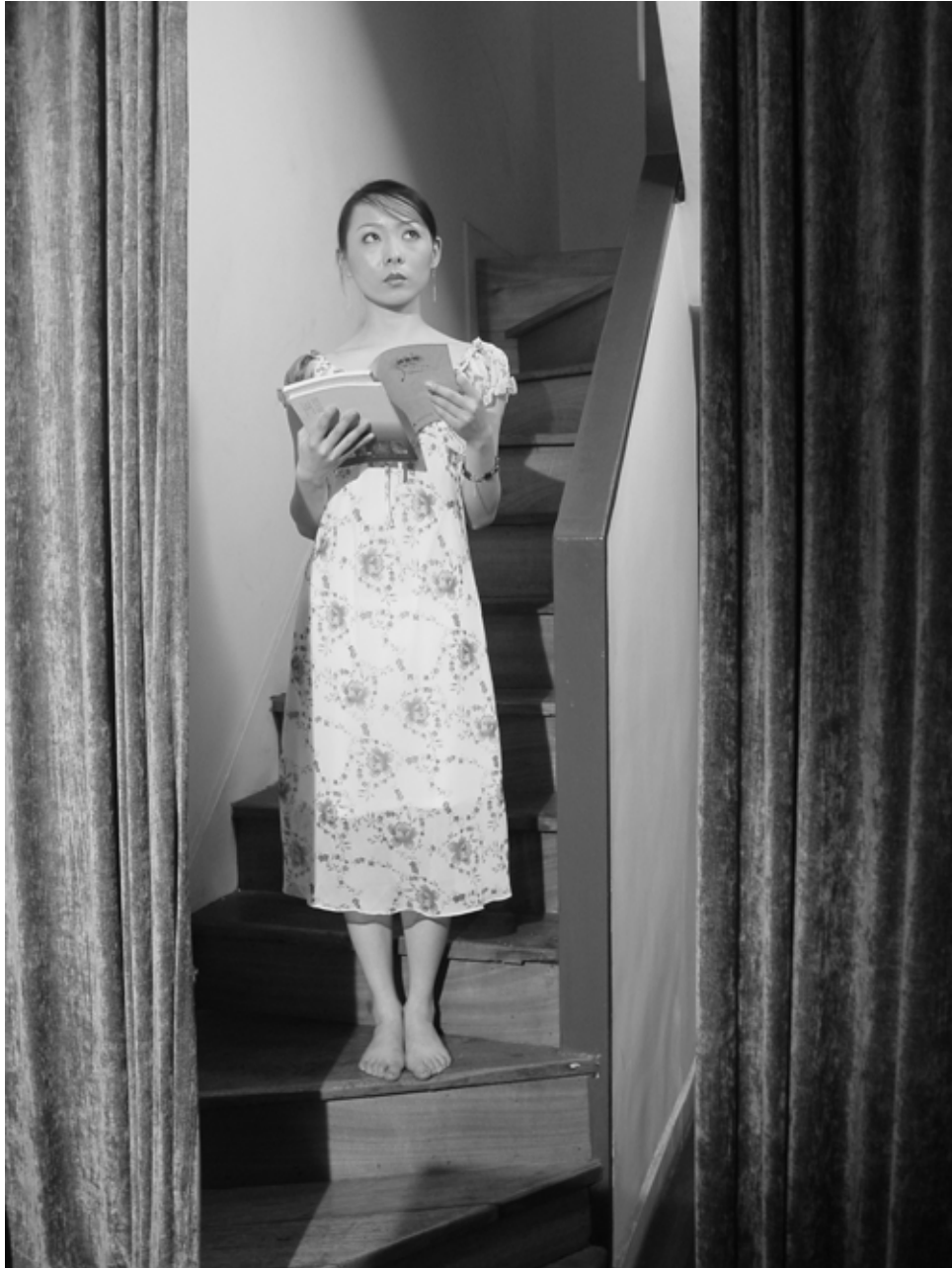
竹林七贤 之二 / Seven Intellectuals in Bamboo Forest, Part 5 (2004) 摄影 / Photo C-Print 114 X 86 cm / Ed.10 / YFDU029