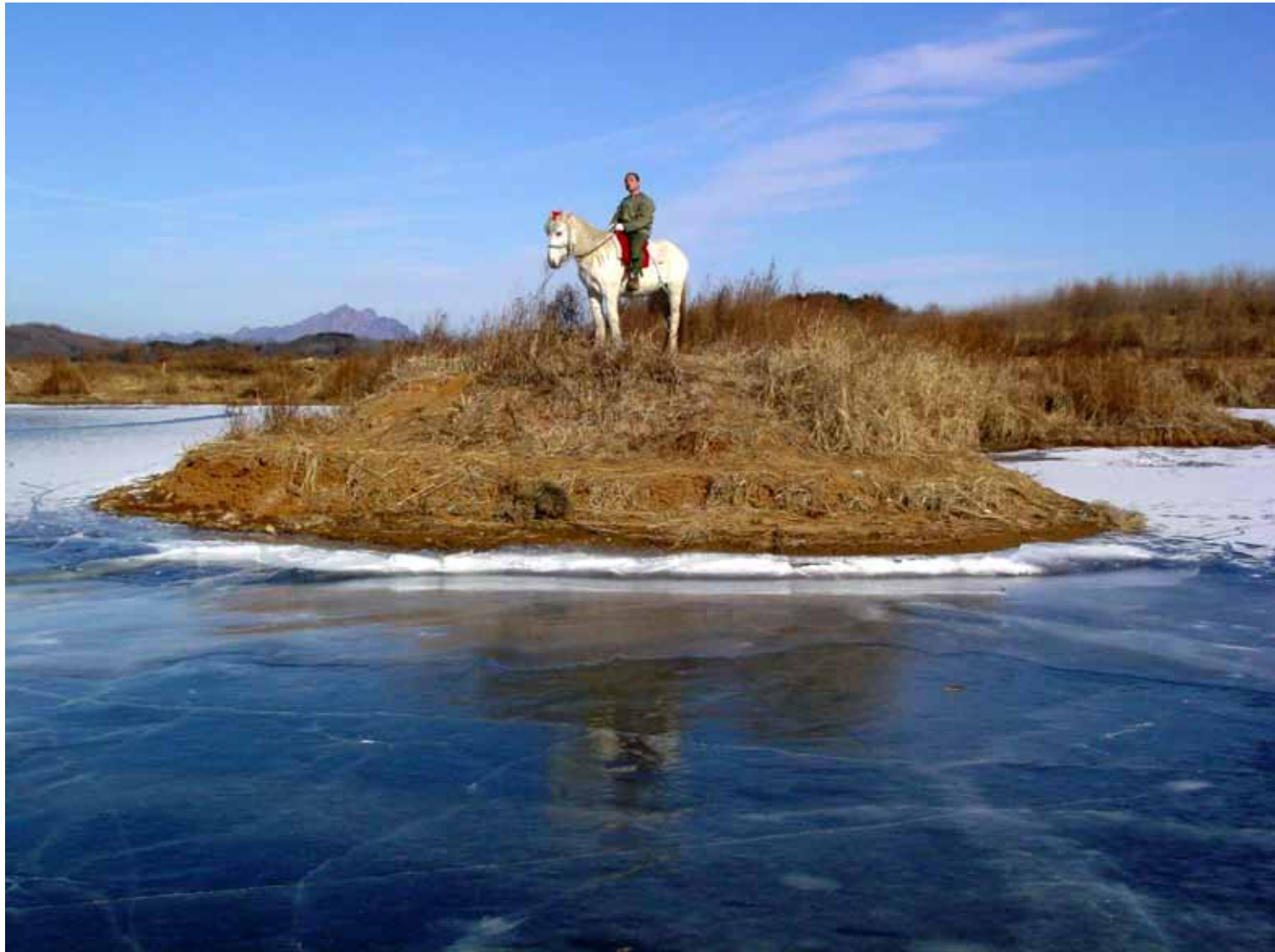
等待蛇的苏醒 / The Revival of the Snake (2005) 剧照 / Image