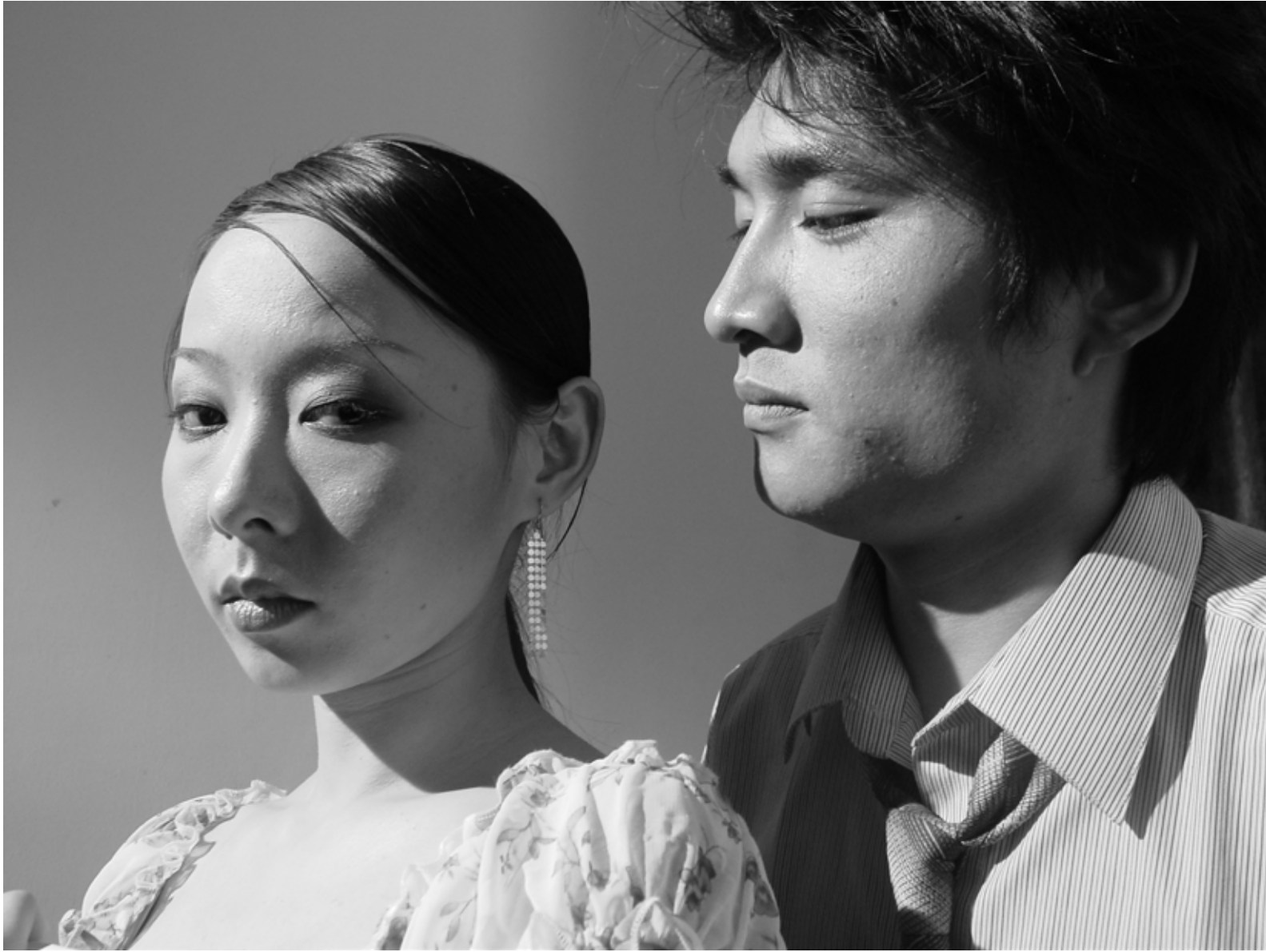
竹林七贤 之二 / Seven Intellectuals in Bamboo Forest, Part 2 (2004) 摄影 / Photo C-Print / 114 X 86 cm / Ed.10 / YFD_7813