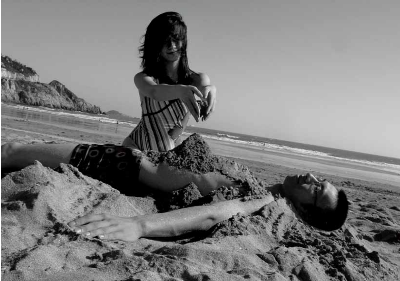
靠近海 / Close to the Sea (2004) 截屏 / Still