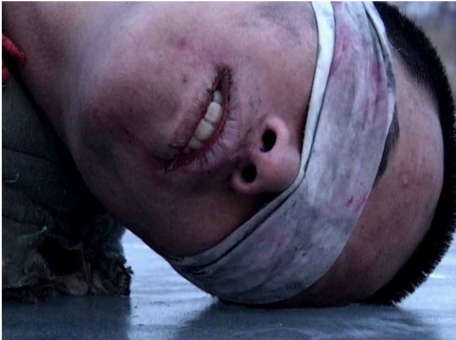
等待蛇的苏醒 / The Revival of the Snake (2005) 截屏 / Still