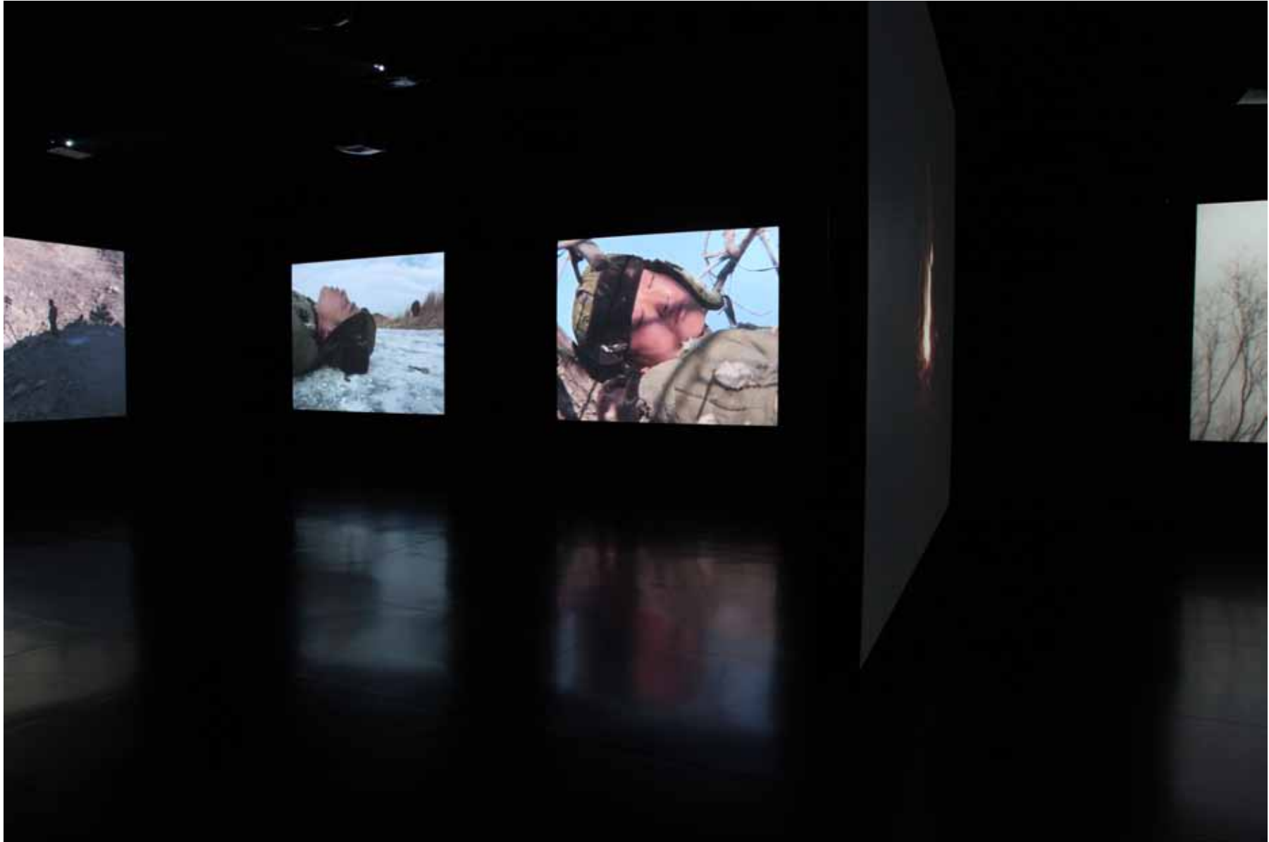
等待蛇的苏醒 / The Revival of the Snake 10屏影像装置 10 channel video installation 8' (2005) YFDV22