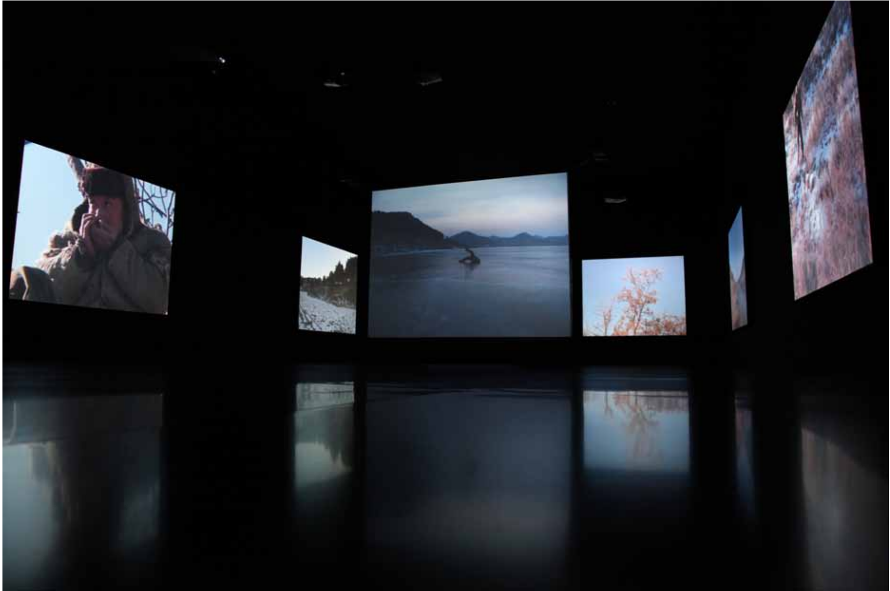
等待蛇的苏醒 / The Revival of the Snake 10屏影像装置 10 channel video installation 8' (2005) YFDV22