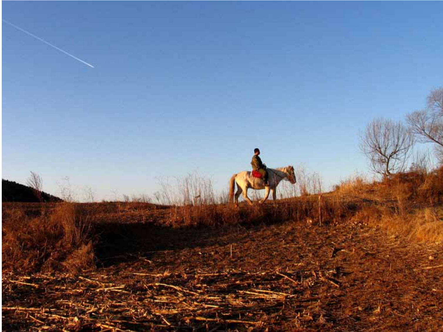
等待蛇的苏醒 / The Revival of the Snake (2005) 剧照 / Image