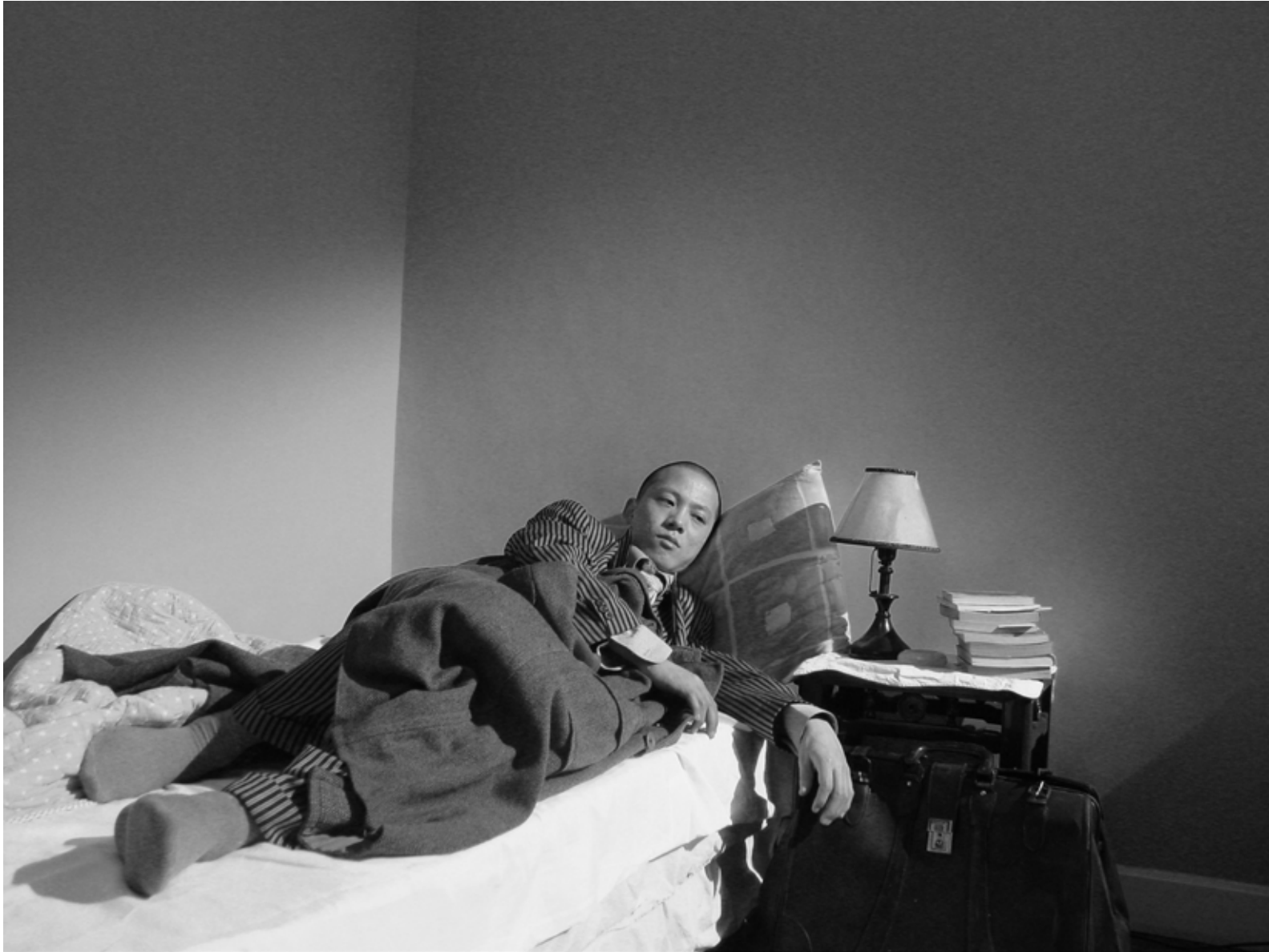
竹林七贤 之二 / Seven Intellectuals in Bamboo Forest, Part 5 (2004) 摄影 / Photo C-Print / 112 X 83 cm / Ed.10 / YFDU084