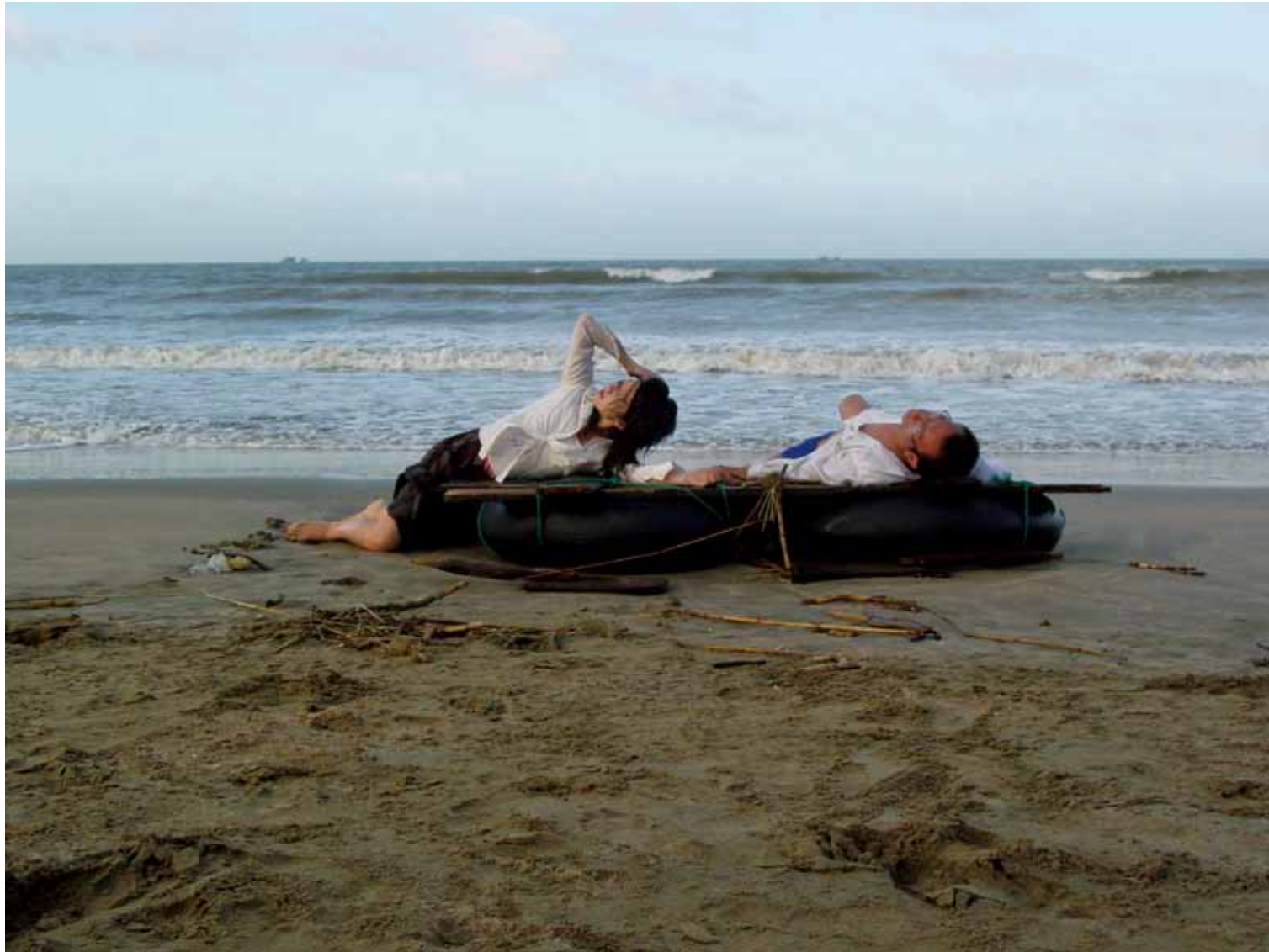
靠近海 / Close to the Sea (2004) 剧照 / Image