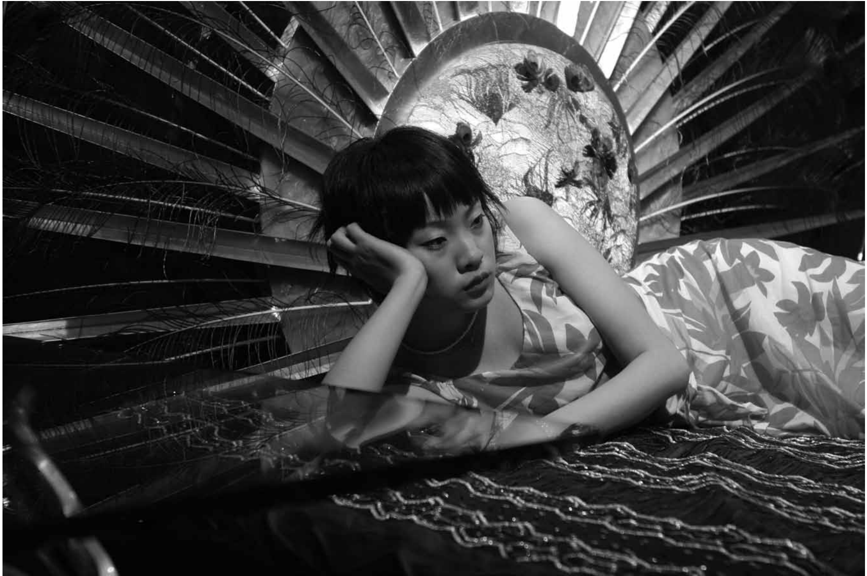
竹林七贤 之五 / Seven Intellectuals in Bamboo Forest, Part 5 (2007) 摄影 / Photo C-Print / 120 X 180 cm / Ed.10 / YFDU089