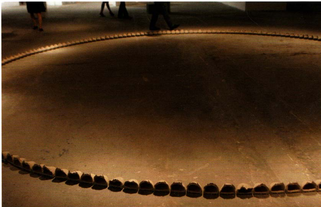
MadeIn, Perfect Volume, 2009, in Seeing One's Own Eyes, installatie met honderd soldatenlaarzen

Zhen, gebeurt dat op een manier zonder al te politiek te worden. Het zijn meer punten van algemene maatschappelijke zorg, die door velen, ook door de Chinese machthebbers zelf, worden gedeeld. Zo ook bij de versnelde klok die hij in 2004 op de Shanghai Biennial exposeerde. De wijzers draaiden als een bezetene rond, de waanzin van de alsmaar accelererende maatschappij weergevend. Xu Zhen heeft naast zijn eigen kunstenaarschap altijd gewerkt als curator. Hij was verantwoordelijk voor bijvoorbeeld Art For Sale (1999), die een kritiek bood op de commerciële kunstwereld in Shanghai, en voor Solo Exhibition (2006), een tentoonstelling met 38 kunstenaars. Elke tentoonstelling van Xu Zhen is een experiment. Hij is om die reden van grote invloed op de ontwikkeling van de lokale kunstscene in Shanghai.