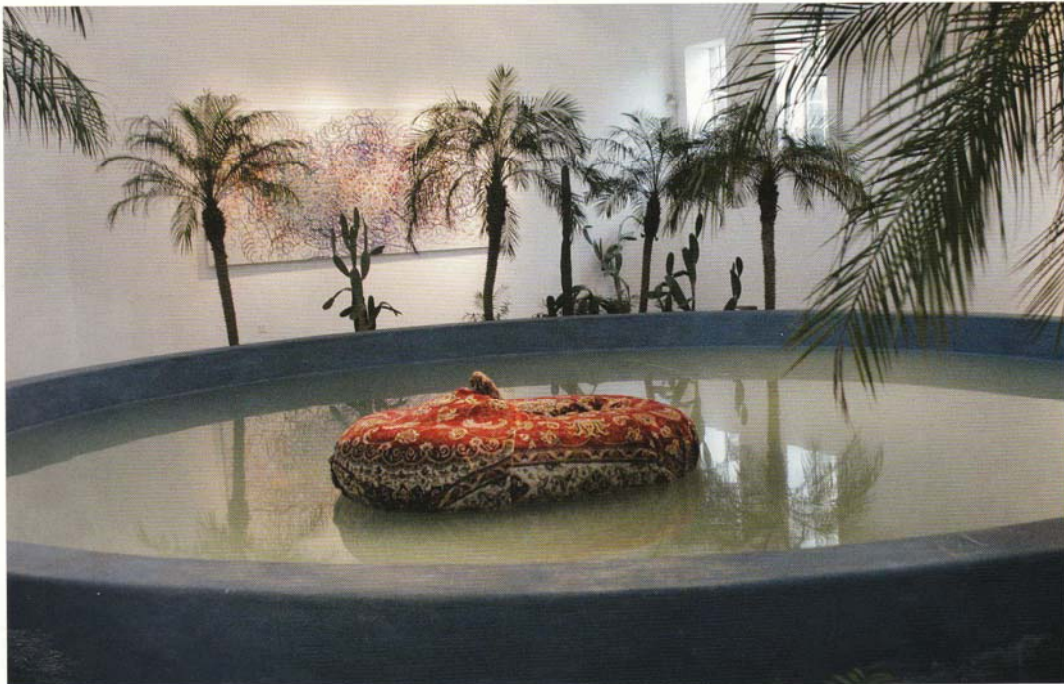
Madeln, installatie uit de tentoonstelling Seeing One's Own Eyes , 2009, boel, zwembad, lijm, courtesy Madeln Company, Shanghai

'Wij doen de kunstenaars een inhoudelijk verzoek en daar gaan ze aan werken. Het maakt vervolgens niet uit of dit Yang Fudong betreft of Liu Wei, of wie dan ook. We leggen de nadruk op het samenwerkingsverband. Het zal voor de kunstenaars een nieuwe vorm van samenwerken zijn, maar ik denk dat ze er heel blij mee zullen zijn. We nemen ook projecten van kunstenaars over, waar ik de rechten voor betaal, waarna we het eventueel bewerken. Ik zie dat als een nieuwe en zeer rijke manier van samenwerken.'