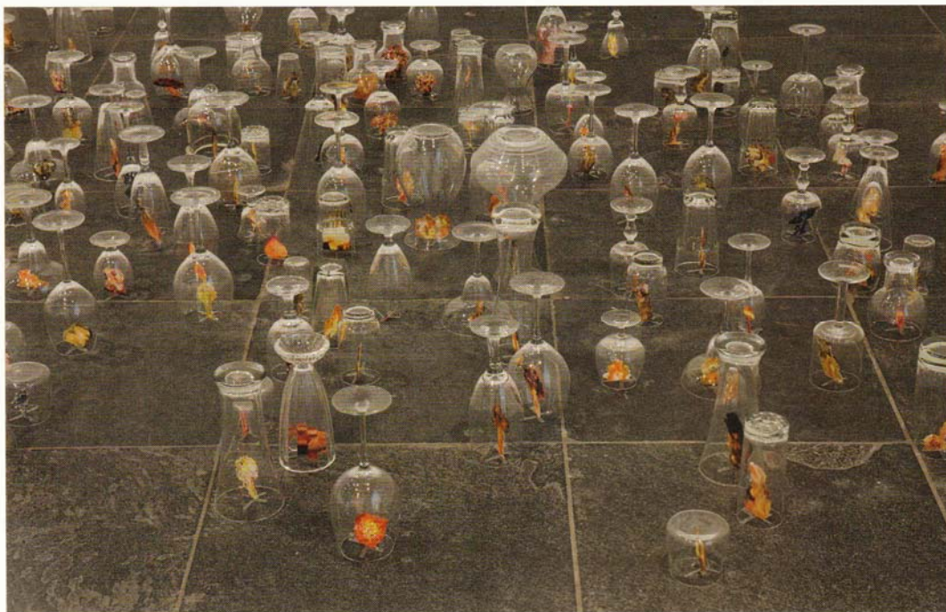
MadeIn. The Color of Heaven , 2009. in Seeing One's Own Eyes

In de presentatie staat het Midden-Oosten centraal. Via een grote biljarttafel wordt het voorgesteld als een speelveld van de supermachten. Her en der op het groene laken liggen kleine puinhopen, die vernietigde dorpen in Irak en Palestina verbeelden. De biljartballen rollen eroverheen. In de werken eromheen wordt op uiteenlopende wijze ingegaan op het Midden-Oostenconflict. Zoals in de perfecte cirkel van schoen- en legerschoenen, die zogenaamd door soldaten zijn achtergelaten; een groot kamerbreed tapijt van puin dat letterlijk ademt; een stad van omgekeerde glazen, met daarin oplichtende afbeeldingen van explosies. Aan de muren hangen onder meer schilderijen die het midden houden tussen Arabische kalligrafie en de drip paintings van Jackson Pollock.