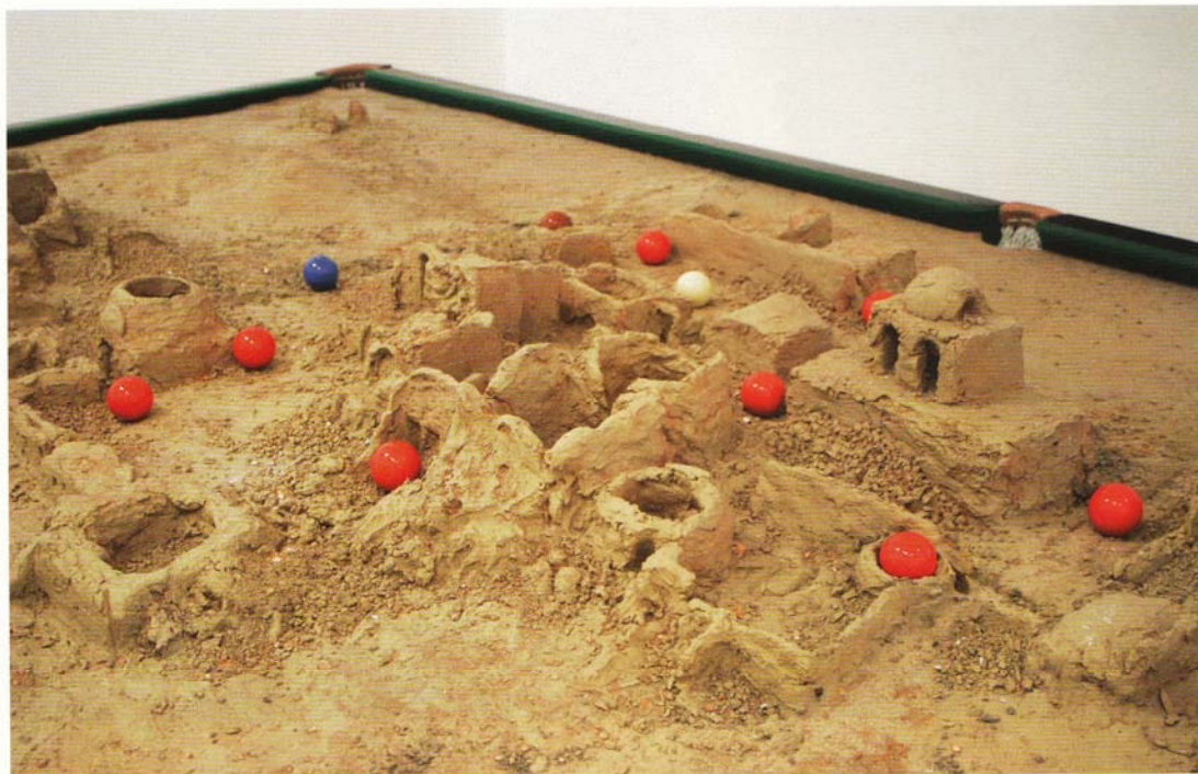
MadeIn. Dual Game , 2009, onderdeel van Seeing One's Own Eyes . © de kunstenaar, courtesy James Cohan Gallery, New York

'Niemand verliest zijn of haar identiteit. Dat kan ook niet, maar we stellen in het bedrijf wel het merk centraal. Als in de designwereld een opdrachtgever het werk van een andere ontwerper wil kopen bijvoorbeeld, speelt er de kwestie van het intellectueel eigendom, waar op zeer zakelijke manier mee omgegaan wordt. In de kunstwereld gaat het bij dergelijk kopiergedrag vaak alleen over het ter discussie stellen van de identiteit van de kunstenaar en de originaliteit van het kunstwerk. Voor ons als MadeIn is de productie het grondbeginsel. Afhankelijk van de verschillende partners waar we mee te maken hebben, ontwikkelen we verschillende soorten van samenwerking. We hopen