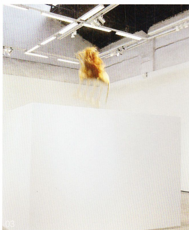
03-06 没顶公司 意识行动（局部） 行为、装置 2011