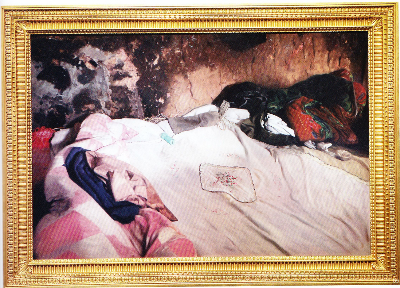
09 没顶公司 猎物—— 贵州省赤水市长期镇 布面油画 126x190cm 2011

以往的展览,但是我们通常确信无疑的作品“标签”这次却撒了谎。作为作品的一部分,标签上写明的作品材质往往是大理石、不锈钢、木头等材料,但是这些媒材在我们的视线中却是不在场的,作品呈现给观者的视觉印象仅仅是挂在墙上的铝版上的数码喷绘图像。标签的诠释造成了作品原有语境的断裂、含混甚至颠倒。通过这些戏谑、调侃的方式,“没顶公司”真正形成了对严肃的当代艺术展览方式和展览体制的质疑。