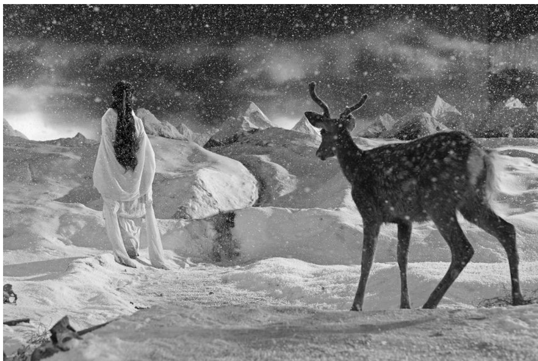
杨福东, 夜将, 2011, 35mm 黑白胶片电影, 19min21sec YANG Fudong, Yejiang The Nightman Cometh 2011, 35mm black and white film, 19min 20sec