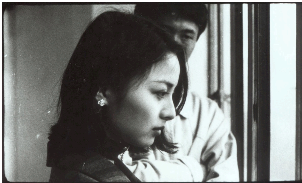
《陌生天堂》, 35 毫米黑白胶片电影, 1997-2002, 76 分钟, 电影截帧 An Estranged Paradise, 35 mm black & white film, 1997-2002, 76 min , film still