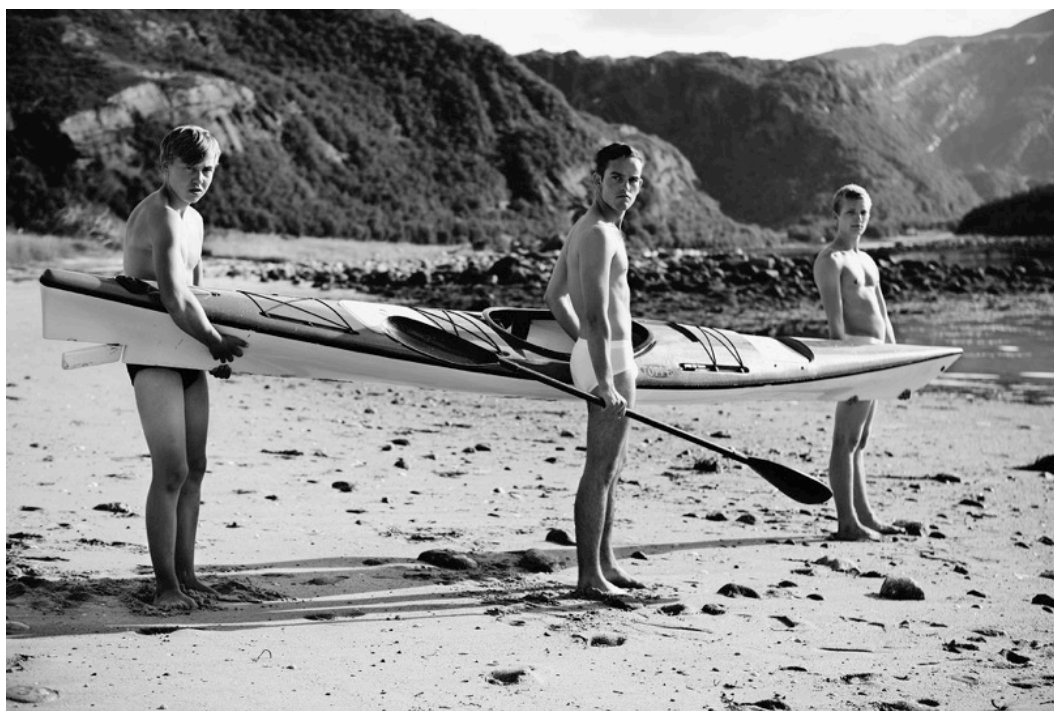
杨福东, 《我感受到的光》, 2014, 八屏影像装置, 桑霍尔恩岛, 挪威 (2014 SALT 合作项目)

Yang Fudong, The Light That I Feel, 2014, 8 channel video installation, Sandhornøya, Norway, (Project commissioned by SALT 2014)