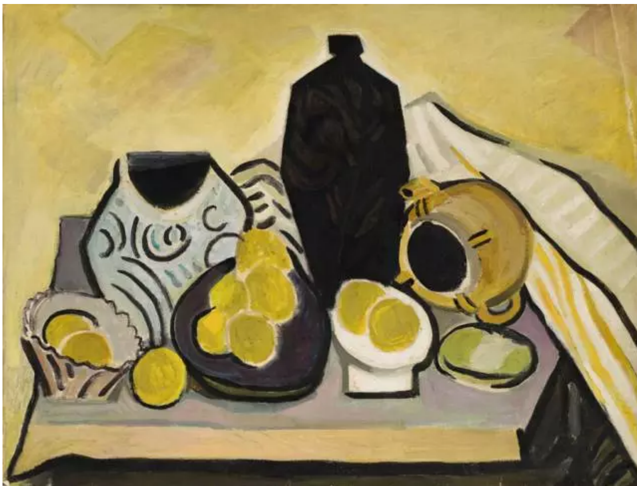
余友涵,《静物1979-17》,1979年,纸上油画,55 x 71 厘米

该展览中最早的两件作品位于二楼，展现了艺术家风格和主题的跨度。《斗兽场》（1988）是余友涵最早的波普作品之一，他运用对比强烈的色彩——钴蓝、亮黄、镉红，描画出古罗马露天剧场。独立于其它的作品单独放置，纸上油画《静物1979-17》（1979）是一幅向乔治·莫兰迪（Giorgio Morandi）和巴勃罗·毕加索（Pablo Picasso）致敬的桌上静物画。