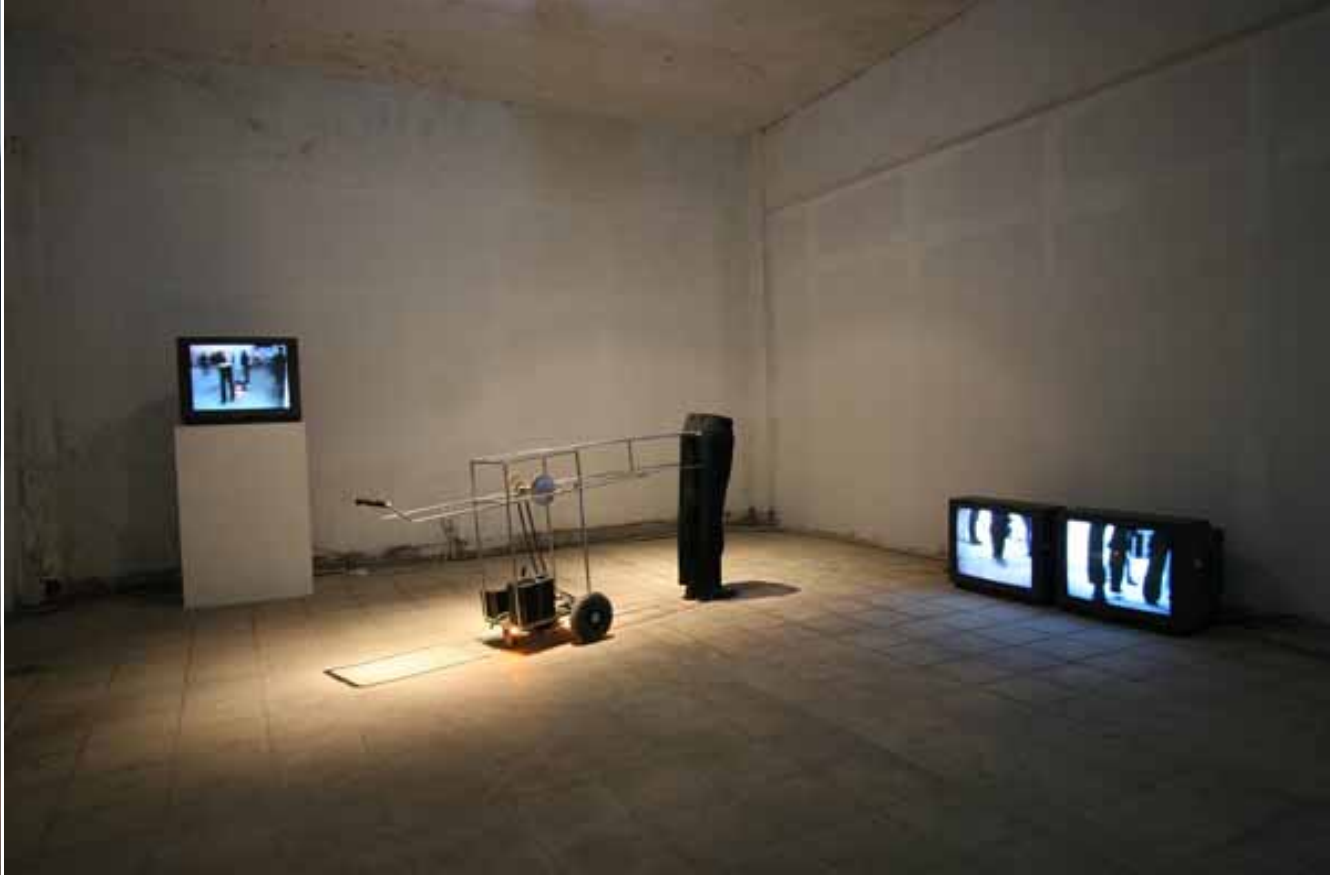
Shi Yong, Sleepwalking, installation, performance / 施勇 , 梦游 , 行为、装置