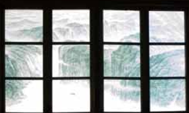
Zhong Su, Public Art, video installation / 钟苏，公共艺术，影像装置