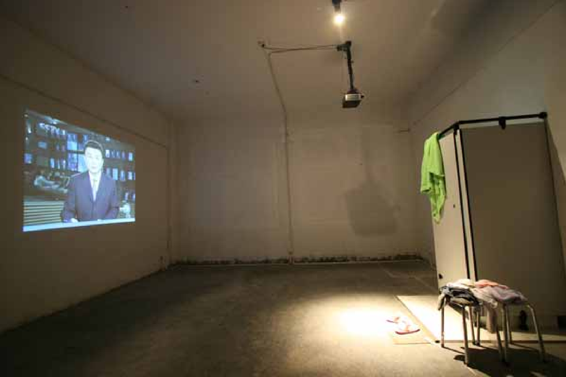
Feng Chen, Zhang Ruyu, Zhang Xutao, Shower Room, Interactive video installation 冯晨，张如愚，张旭涛，淋浴室，影响互动装置