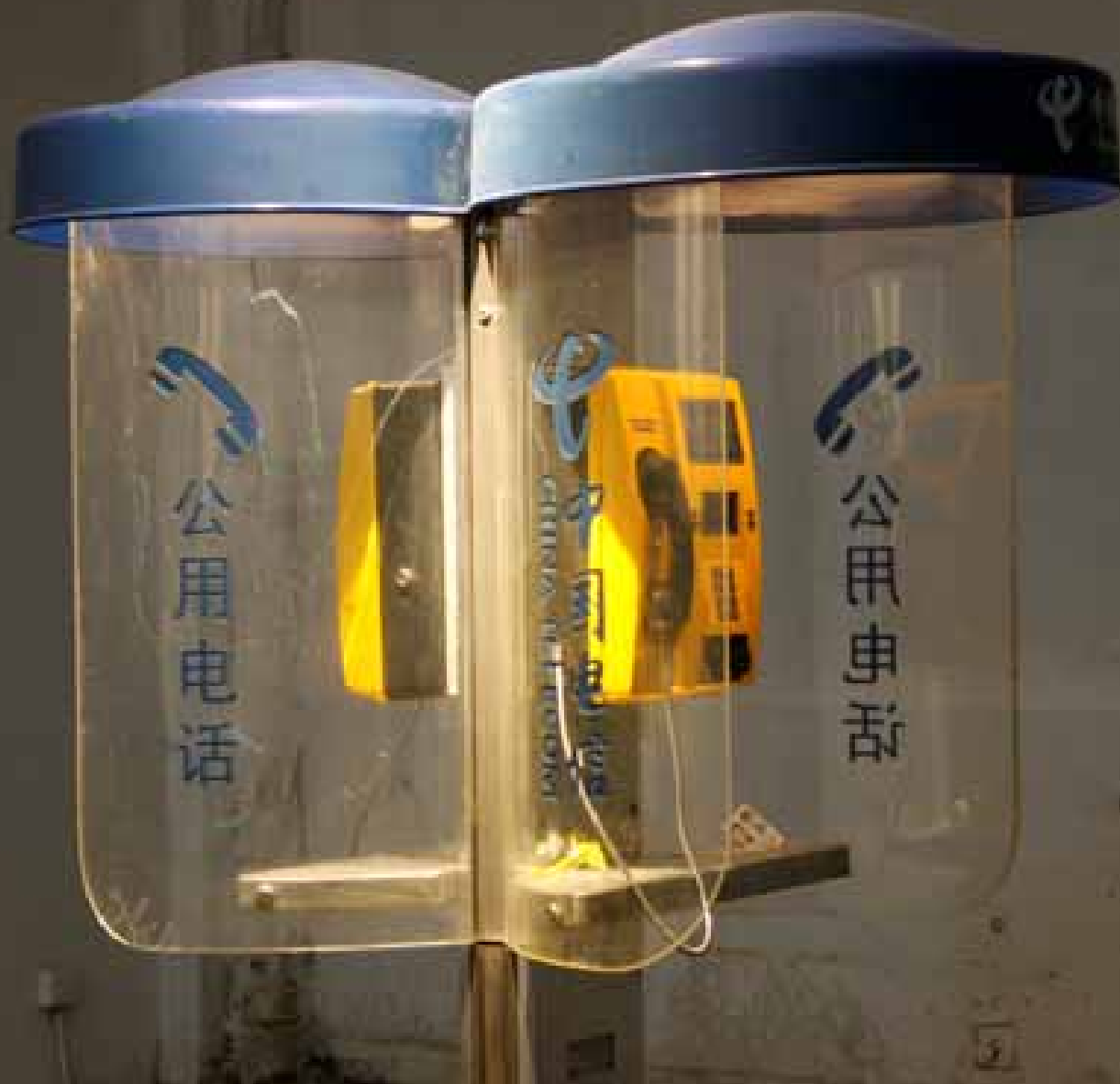
Sun Huiyuan, Transient Dialog, installation / 孙慧源，暂时性对话，装置