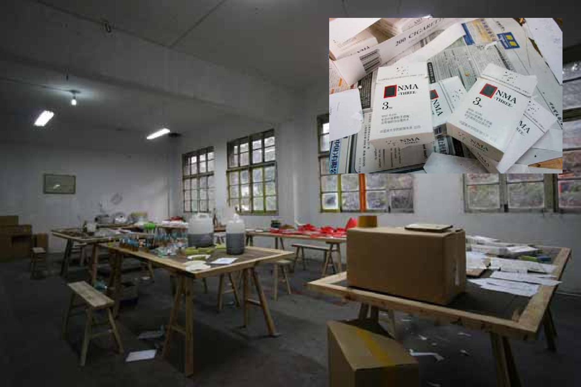
Li Wen, Produced, installation / 李文，生产了，装置