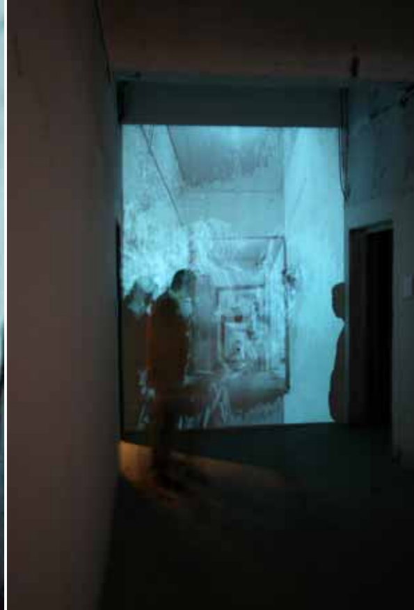
Wu Juehui, Has Gone, interactive video installation 吴珏辉，走了，互动影像装置