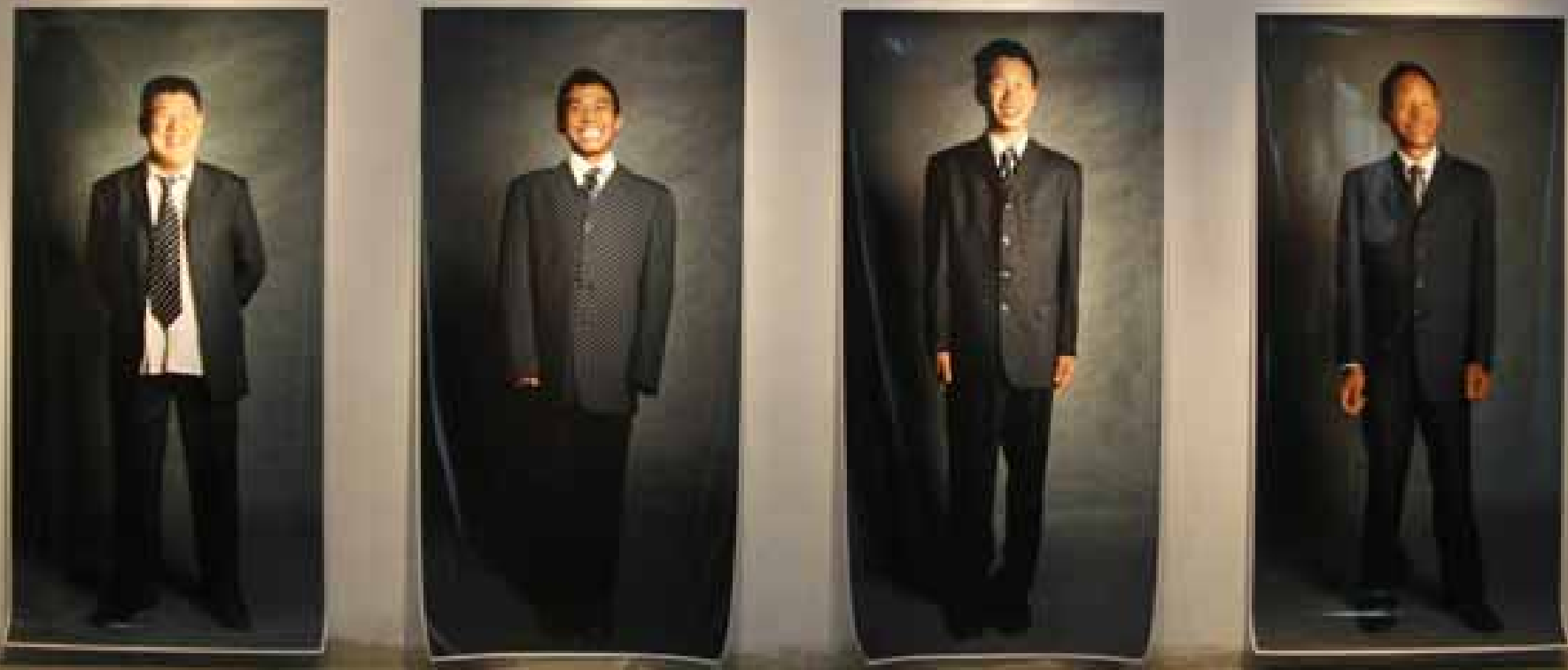
Shao Yi, Intervention, series of 10 photographs / 邵一，介入常常，摄影