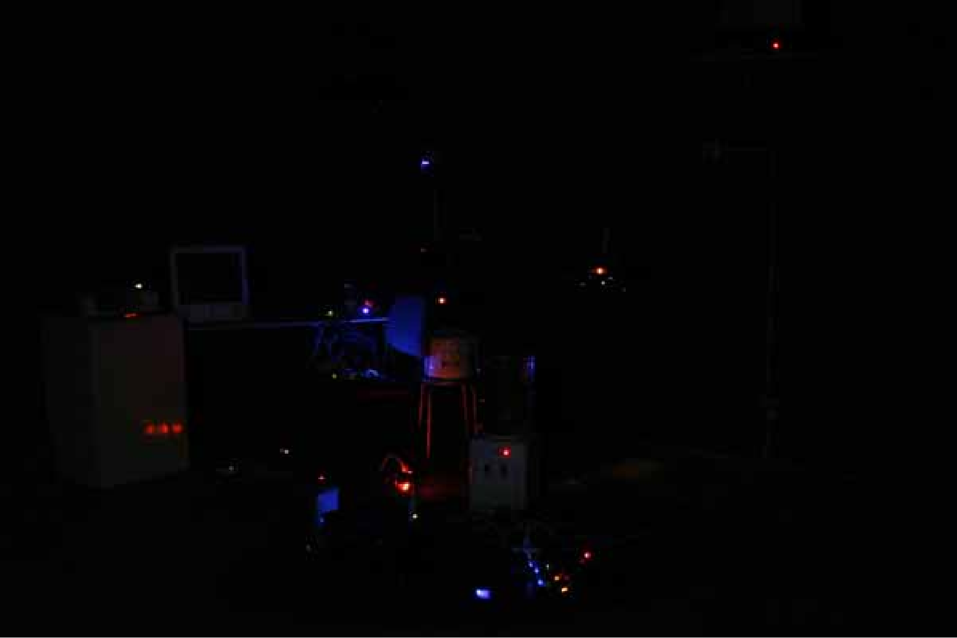
Chu Yun, Constellation, installation / 储云，星群，装置