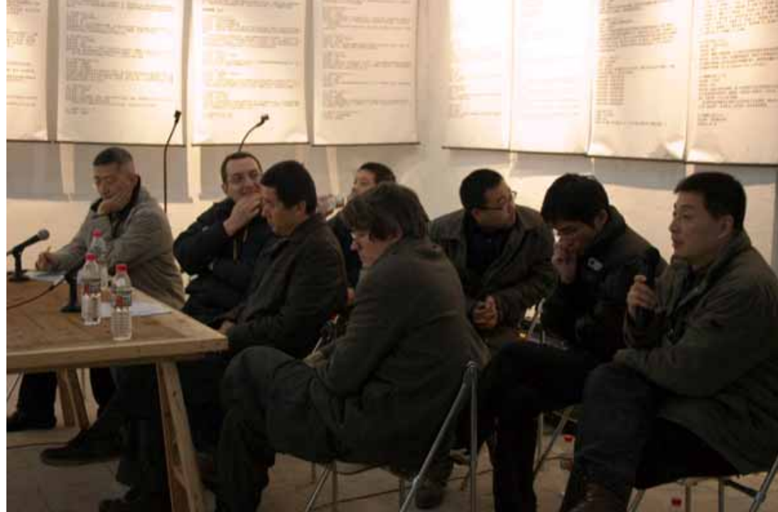
Press conference / 新闻发布会