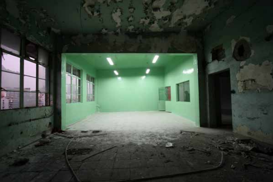
Zhang Peili, Restoration, mixed media 张培力，修旧如旧，综合材料