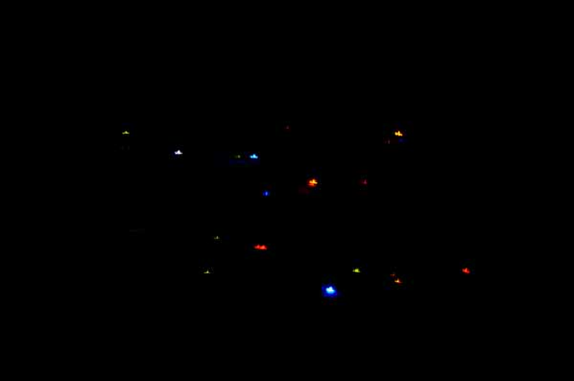
Chu Yun, Constellation, installation / 储云，星群，装置