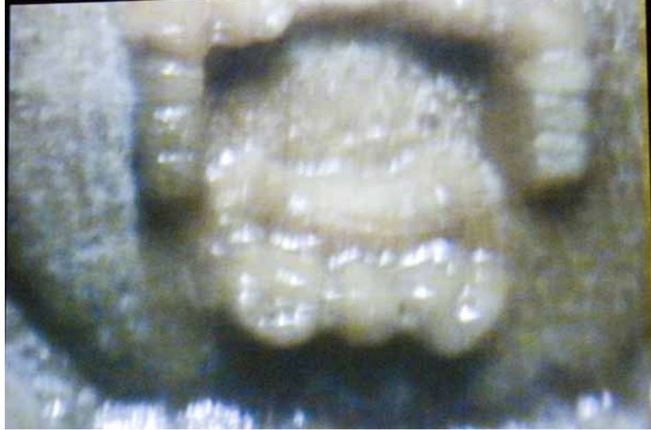
Zhang Qing, 1 mm/min, installation video 章青，1毫米/分钟，装置录像