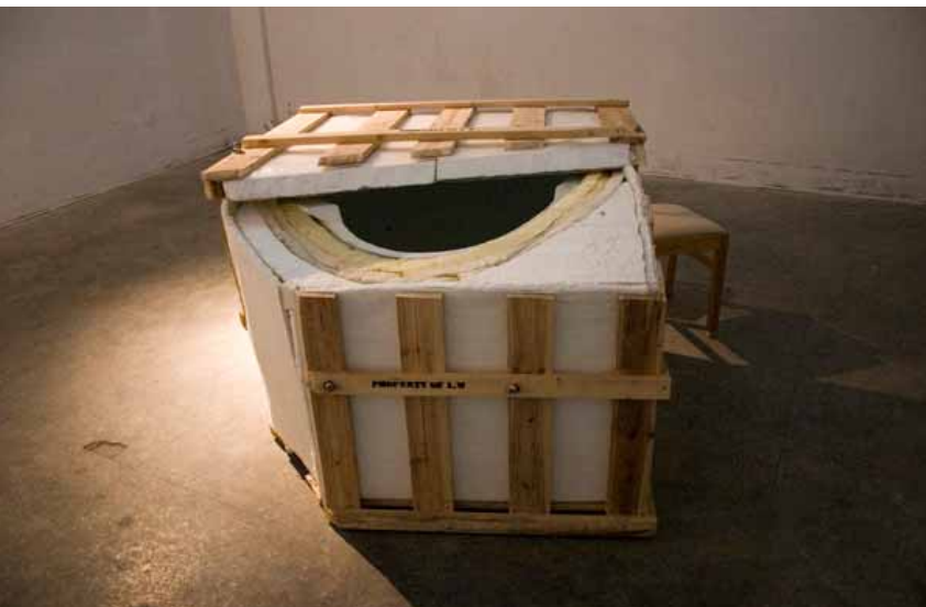
Liu Wei, Cut it, it's mine, installation 刘韡，切了它，就是我的，装置