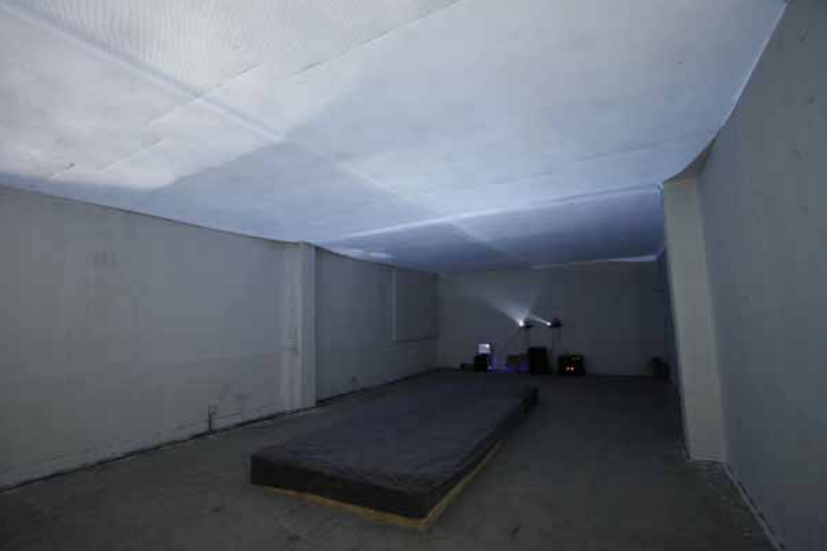
Yang Qingqing, Airplane, video installation, loop 杨青青，飞机，录像装置、循环播放