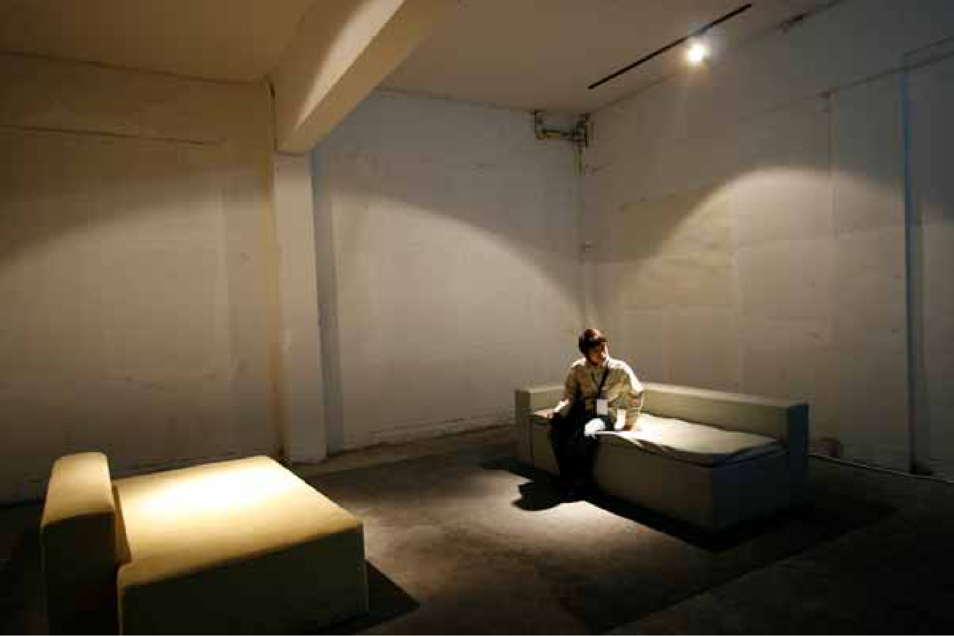
Cui Shaohan, Resting area, installation / 崔绍翰，休息区，装置