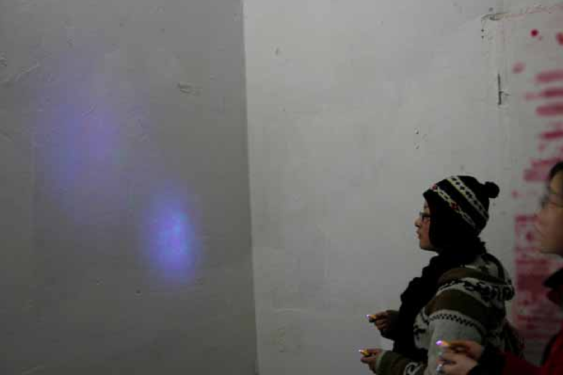
Wang Xin, Trace, installation / 王欣, 痕迹