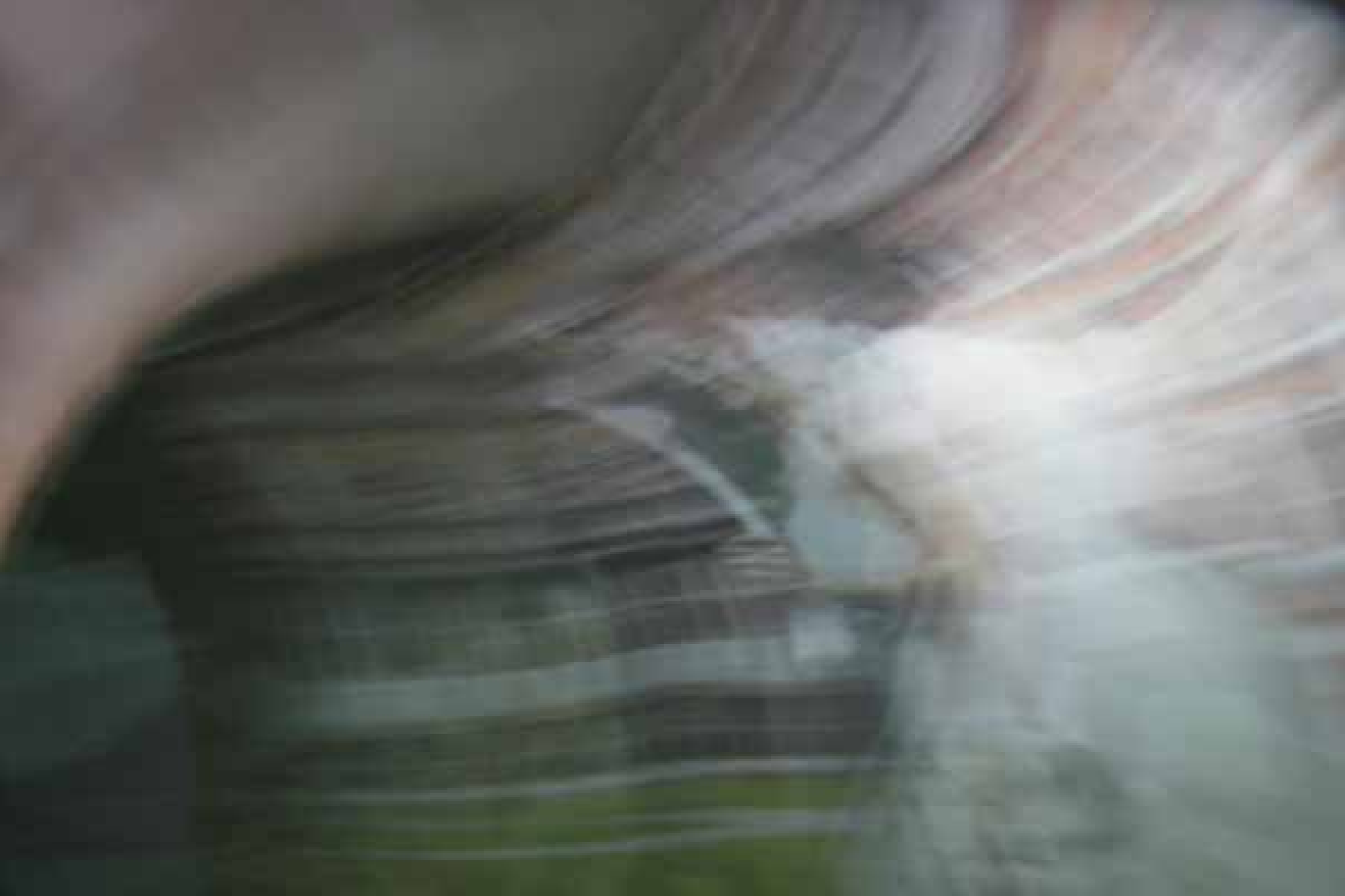
Alexander Brandt, Brainwashing is a kind of entertainment, video installation 飞苹果，洗脑式一种乐趣，录像、装置