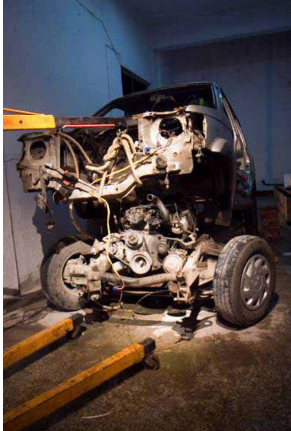
Xu Zhen, 18 days / 徐震, 18天