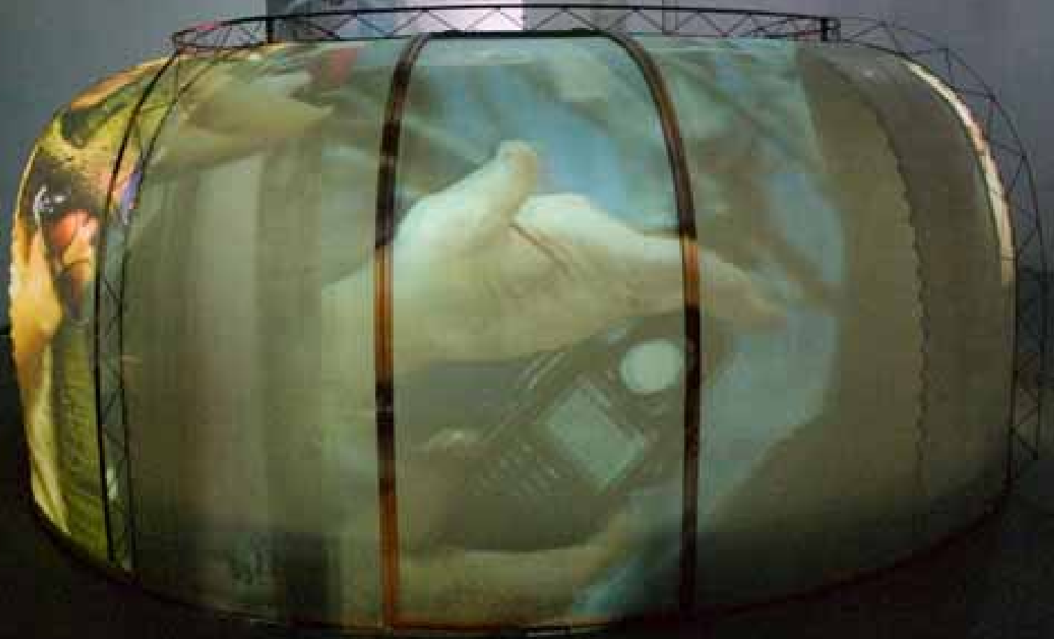
Alexander Brandt, Brainwashing is a kind of entertainment, video installation 飞苹果，洗脑式一种乐趣，录像、装置