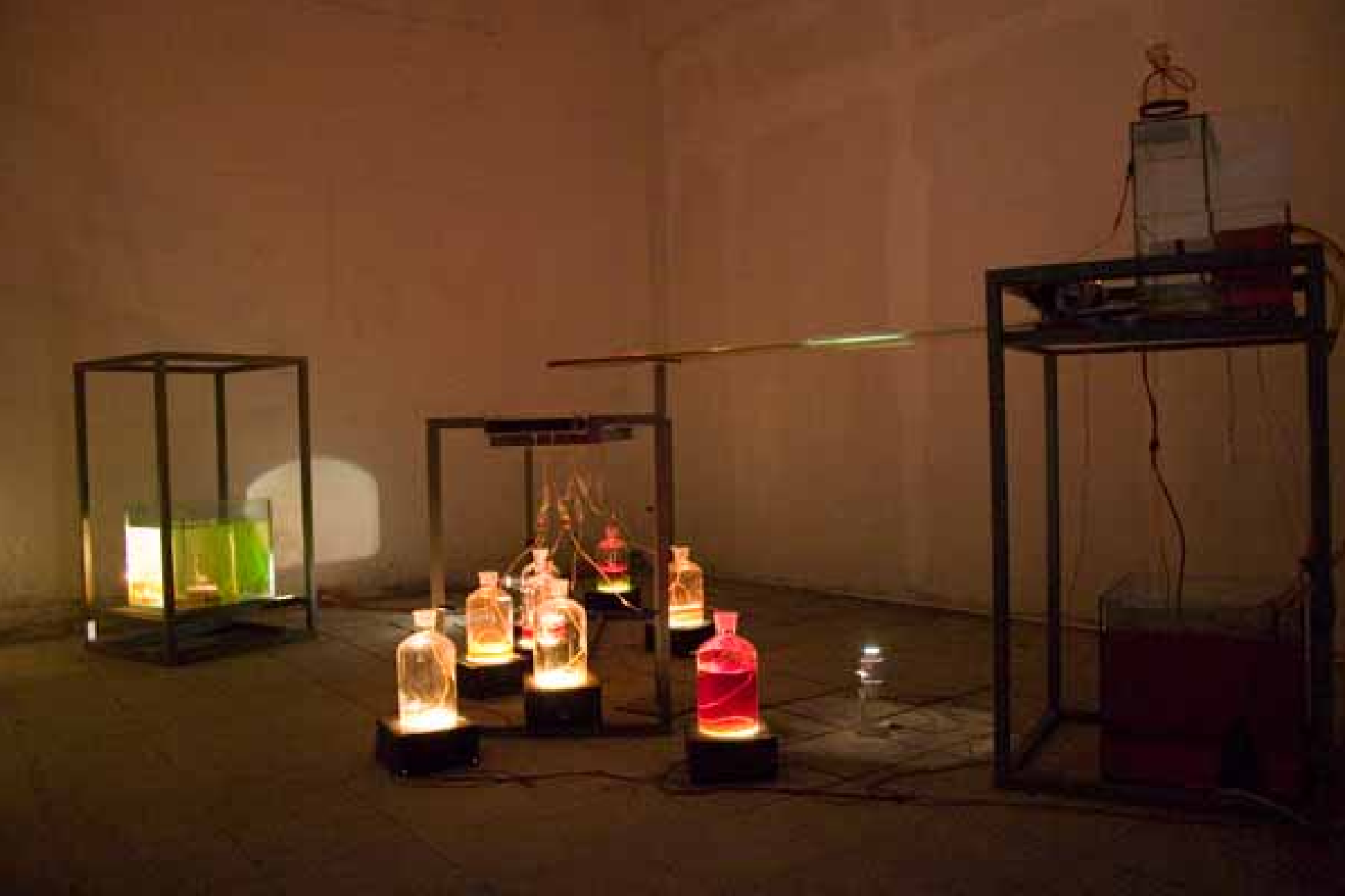
Shi Chuna, Disbanded 21 cm, installation / 石川，解散的21厘米，装置